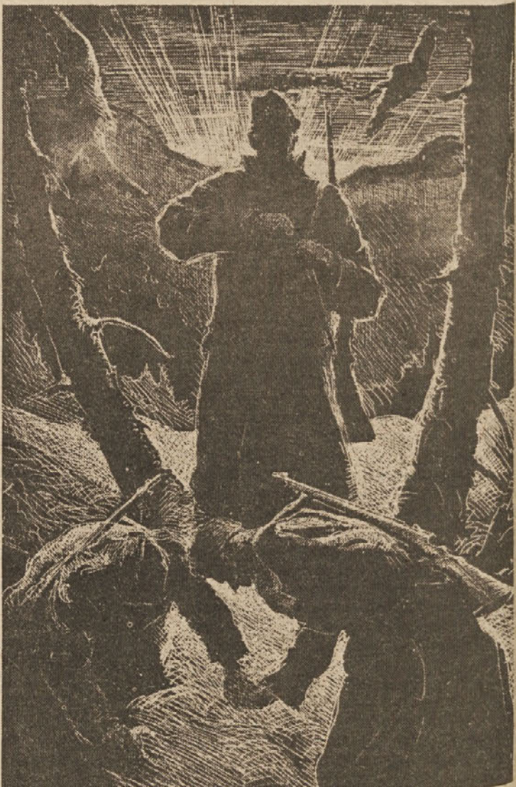
Pogreb komandanta, visoka jedkanica, 1948, Božidar Jakac