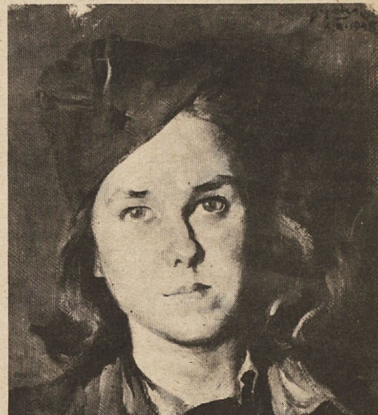
Partizanka Lučka, olje, 1945, Božidar Jakac

Treba je sprejeti sistemske, socialno-pedagoške in druge ukrepe, s katerimi bomo vsaj