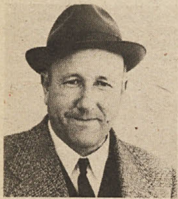
ga Bardha kaj malo mar. Dejali so mu: Poprimi za razrednico!

Tovarišem, s katerimi je bil v vojni, je bilo sanjanje mlade-