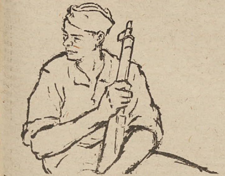
Borec s puško, Djordje Andrejević Kun (Muzej sodobne umetnosti Beograd)

... V stari Jugoslaviji in še prej so ocenjevali učitelja po