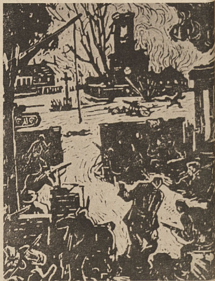
Iz boja v Bolmanu, linorez, 1945, Martin Solarzik

Bogato kulturno življenje je potekalo povsod, kjer so bile enote NOV in POJ ali poznejše jugoslovanske armade. Prosvetno delo v vojski: tečaji za opismenjevanje, politična predavanja, stenski in ustni časopisni sistemi, moramo razvijati dalje.