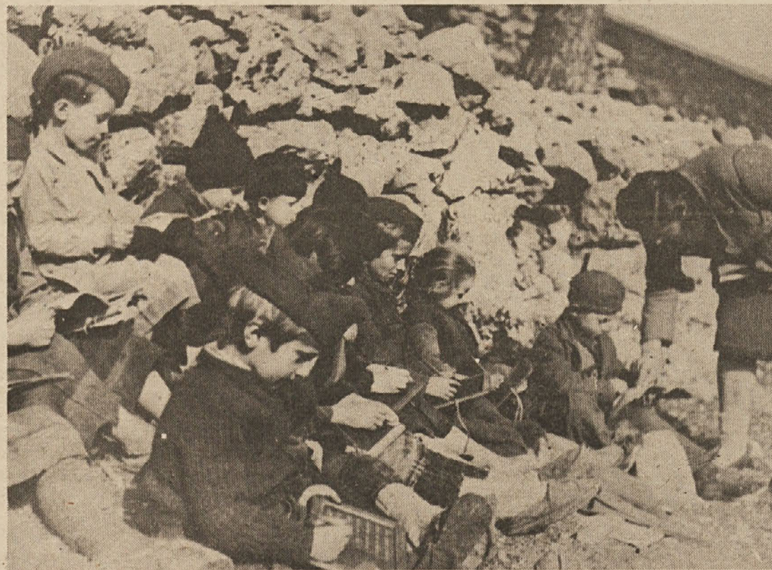
Šola je porušena — pouk je na prostem med skalami

pismene. Zaradi posebne skrbi, ki smo jo posvečali izobraževanju, so se zelo povečali kvalifikacijski sestavi zaposlenih ter raven njihovega znanja, spretnosti in poklicne zavesti. Izboljšala se je kakovost pouka, razvili so se novi samoupravni odnosi, v katerih imajo tudi učenci pomembno mesto. Razumljivo je, da se to pozitivno zrcali v povečani produktivnosti, višji življenjski ravni, bolj