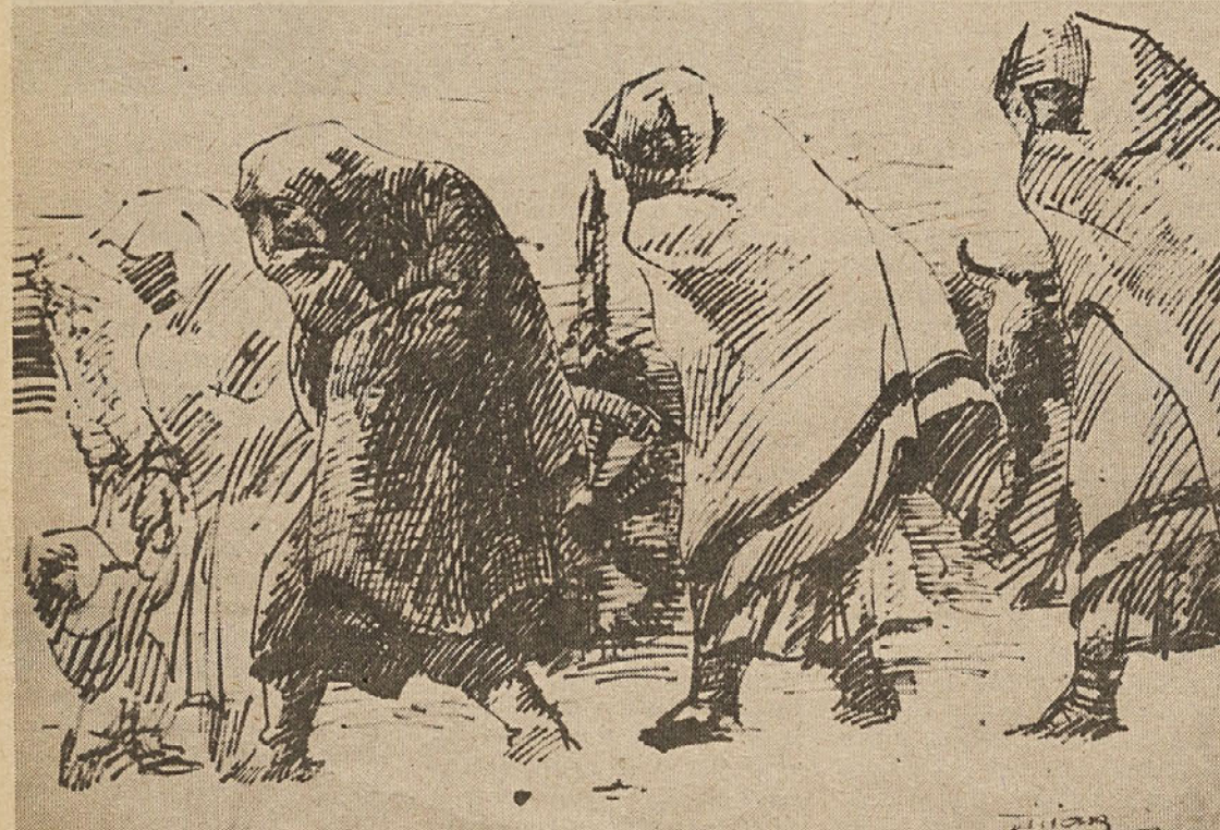
V izgnanstvu, Djuro Tiljak

Pri akciji za uresničevanje kongresnih resolucij o socialistični samoupravni preobrazbi vzgoje in izobraževanja zavzeto sodelujejo vsi družbeni dejavniki v republici. Zaustaviti je niso mogle niti pomanjkljivosti niti odpora niti mnenja, češ da je ta zelo pomembna in zaple-