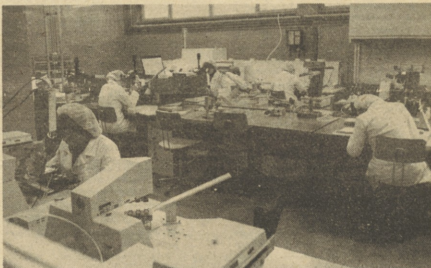
V proizvodnji integriranih vezij