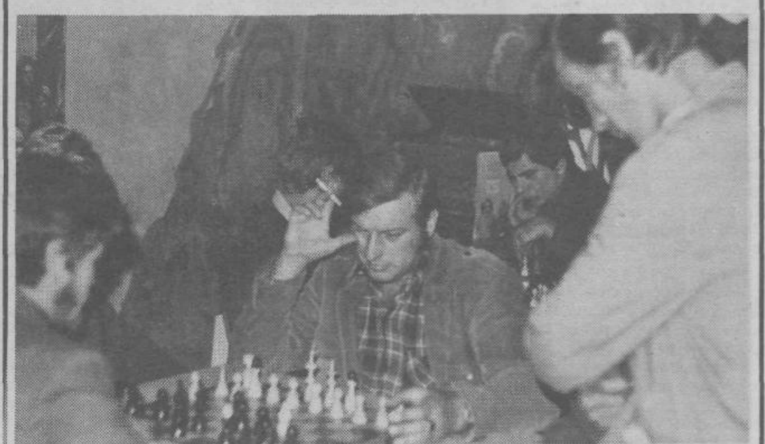
V šahovskem klubu, ki so ga mladi organizirali v okviru mladinskega aktiva Zalog, je vedno gneča. Mladi ljubitelji šaha radi sedajo za šahovnice.