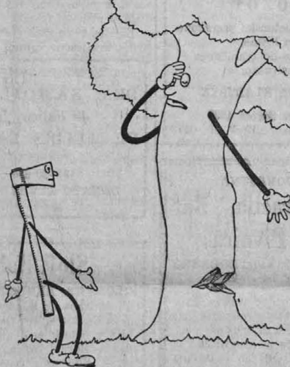
Drvo in sekira

Napake velikih duhov se kažejo najjasneje pri njihovih posnemovalcih.