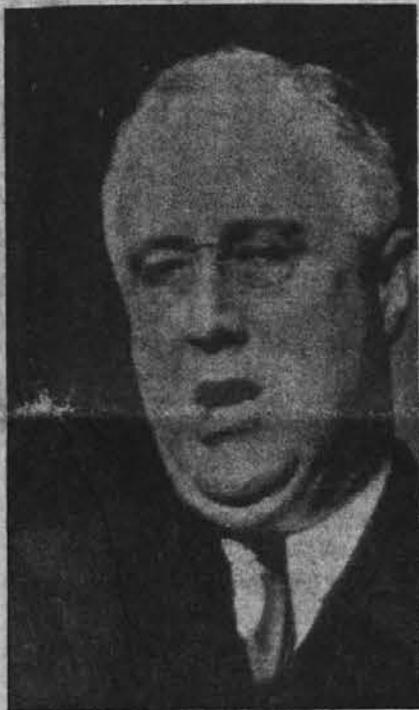
Predsednik Združenih držav Franklin Roosevelt

Ker še niso polki na pohodu, je nadaljeval Roosevelt, sem mnenja, da bi se dalo brez prelivanja krvi vse zadeve urediti, če sta Hitler in Mussolini res za mir, kot ob vsaki priliki zagotavljata, a sta medtem vendar že tri narode podjarmila v Evropi enega pa v Afriki. Nikdo bi ne smel samovoljno z vojno podjarmiti drugi narod, pa četudi bi bila v njem kaka notranja nesoglasja. Amerikanci ne želimo miru iz egoizma ali