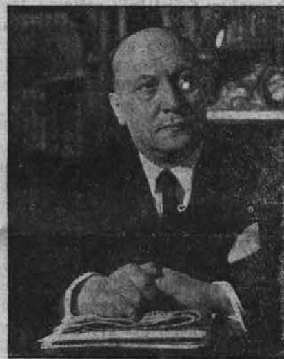
Cincar-Markovič, jugosl. zunanji minister, ki pojde v Rim

se je že takrat izjavila, da se bosta Francija in Anglija kmalu bridko kesali svojega popuščanja. In se niso zmotili. V Moskvi nič ne prikrijevajo, da sedanjim angleškim in francoskim državnikom ne zaupajo, kajti obe veliki demokraciji sta gledali samo za tem, kako bi porivali v ospredje manjše države in če bi se naknadno posrečilo zaplesti tudi Rusijo v oborožen konflikt s totalitarnimi režimi. V tem boju bi se fašizem in komunizem, kot smatrajo ideologiji, ki se borita na nadoblast med Rimom in Berlinom na eni in Moskvo na drugi strani, popolnoma uničili ter bi angleški in francoski kapital, ki se skriva za demokracijo, zavladal spet nad Evropo in svetovnim trgov. Hitler in Mussolini dobro poznata te ljudi in sta prepričana, da zanje sovjeti nikoli ne bodo šli po kostanj v žerjavico. Dokler