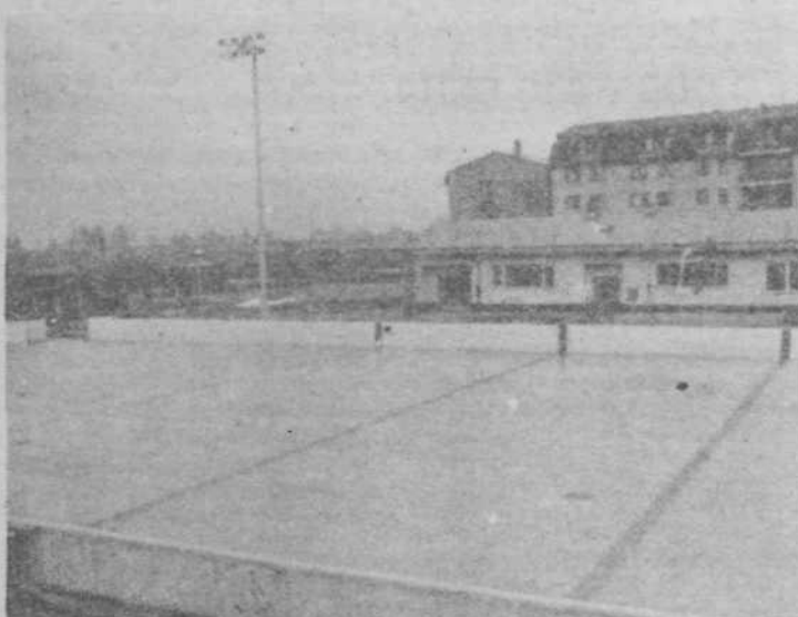
Drsališče v Zalogu

Jelka Krženjak, VVO Jarše: »Kupi papirja: priprave, raziskave, analize in razna druga dokumentacija odtegujejo nas, pedagoške delavce od dela z otroki in nas čedalje bolj priklepajo za pisalne mize... A vemo, da je dobra naložba v otroka hkrati tudi najboljša gospodarska naložba.«