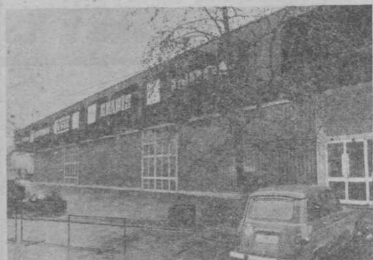
Športna dvorana Kodeljevo