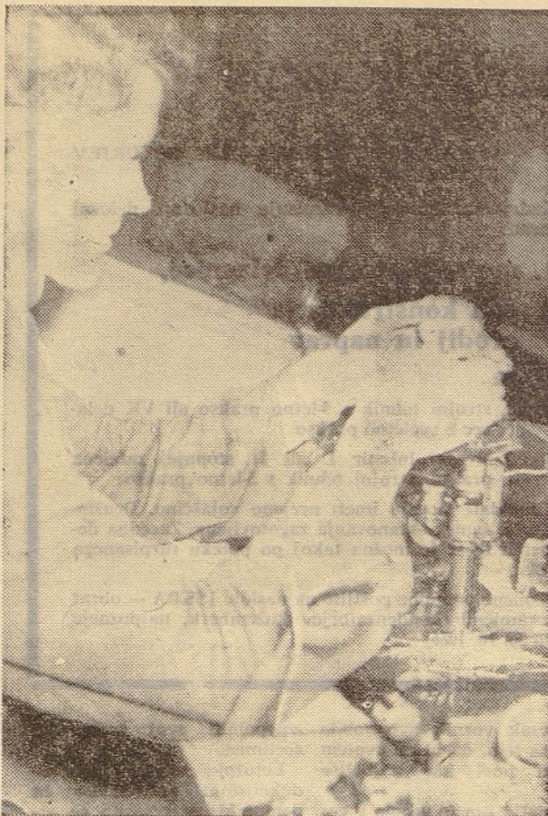
Delavec pri fokusiranju asimetričnih avtomobilskih žarnic