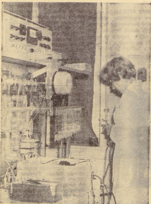
K članku o obratu »žarnice« na 5. strani — Crpanje koronjskih stabilizatorov terja natančno delo

Opomba uredništva: iz objektivnih razlogov se je objava gornjega nekrologa žal zakasnila do današnje številke.