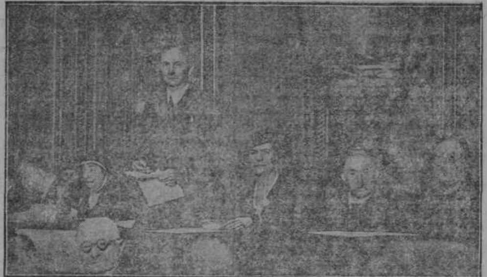
Pariška konferenca za razorožitev, katero so napadli francoski nacijonalisti, Teh posvetovanj se je udeležilo več odličnih ženskih osebnosti.

stvo je izdalo poročilo, v katerem ugo- tavlja, da znašajo dolgovi banovin in občin 1543 milijonov dinarjev. Od te vsote odpade največ, in sicer 1337 mili- jonov dinarjev, to je 87 odstotkov na občine. Beogradska občina pa ima 452 milijonov dinarjev dolgov, torej na ene- ga prebivalca pride 1867 Din, zagreb- ška 180 milijonov — na enega prebival- ca 966 Din, Ljubljana 148 milijonov — na enega prebivalca 2467. Po tem izka- zu je Ljubljana najbolj zadolžena. Med banovinami, ki so zadolžene za 143 mili- jonov Din, je najvišje zadolžena Drav- ska banovina, na katero odpade 20.2% skupne zadolžitve banovin. Podeželskih občin je 4283, od teh je le 391 zadolženih v skupnem znesku 63 milijonov Din.