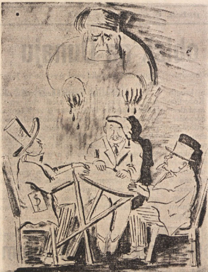
Zli duh iz preteklosti na sestanku „velikih“

Koraj je torej Sovjetska zveza bila prisiljena vsaj navidezno ublažiti svojo napadalno politiko, že postajajo slične mere spet očitnejše na ameriškem zapadu. Trenutek sovjetske slabosti tam gotovi krogi skušajo izkoristiti za svoje naklepe in zahteve po nasilnem „osvobajanju“ Vzhodne Evrope v želji, da bi za ta-