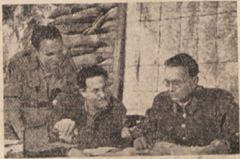
TITO Z EDVARDOM KARDELJEM IN VLADIMIRJEM BAKARIĆEM NA VISU