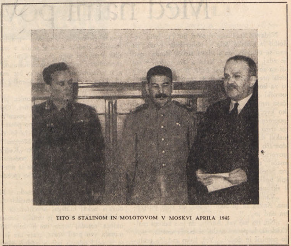
TITO S STALINOM IN MOLOTOVOM V MOSKVI APRILA 1945

Stalin je začel nato vpraševati o posameznih buržoaznih politikah v Jugoslaviji, vpraševal, kje so, kaj počno, jaz pa mu odgovarjam: