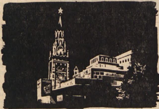
Akademski slikar France Mihelić: MOSKVA — LENINOV MAVZOLEJ

Na tem prvem sestanku se je stvar s Stalinom zaostri. Bolj ali manj sva se spoprijela pri vseh vprašanjih, o katerih sva se razgovarjala. Takrat sem zapazil, da Stalin ne trpi, da mu kdo ugovarja. Pri razgovorjanju s svojimi ljudmi postopa nevljudno, osorno. Od članov Politbiroja CK VKP(b) le Molotova kdaj pa kdaj vpraša, kaj misli, pa še njega ne posluša do konca, marveč nadaljuje svojo misel.