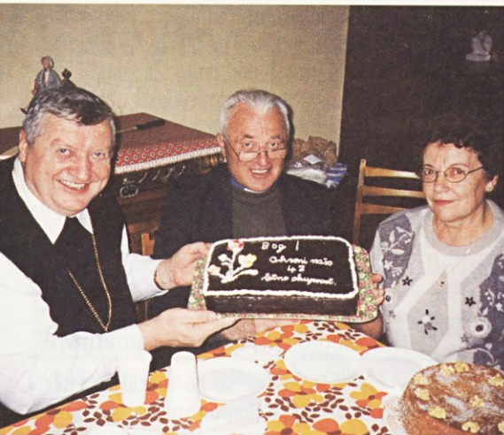
V 42-ih letih prvi pastoralni obisk slovenskega škofa pri rojakih v Marseillu

Komisija Pravičnost in mir pri Slovenski škofovski konferenci je pripravila posebno izjavo oziroma "apel javnosti" proti izkoriščanju zaposlenih in za zaščito družine, v kateri med drugim ugotavlja, da so v Sloveniji razmere pri zaposlovanju žensk in varstvu materinstva ter družinskega življenja zaskrbljujoče. Pri tem komisija posebej opozarja na vprašanje podaljševanja delovnega časa v nekaterih dejavnostih, zlasti v trgovini, kjer med zaposlenimi prevladujejo ženske. Komisija Pravičnost in mir pri Slovenski škofovski konferenci je prepričana, da mora država z ustrežno ureditvijo ščititi družino in družinsko življenje kot temeljno celico družbe. Potrebno je ustvarjati čim bolj ugodne možnosti za to, da bodo starši in otroci živeli skupaj v "složni družinski skupnosti", ki bo imela čas zase in za razvijanje medosebnih razmerij. To pa se lahko zgodi le tedaj, če bodo imeli vsi člani družine možnost, da vsaj en dan v tednu preživijo skupaj ter da se vsak večer zberejo v družinskem krogu. Po mnenju komisije je namreč uvajanje nočnega in nedeljskega dela, kadar to ni nujno, nesprejemljivo in ga je potrebno omejiti na najmanjšo možno mero.