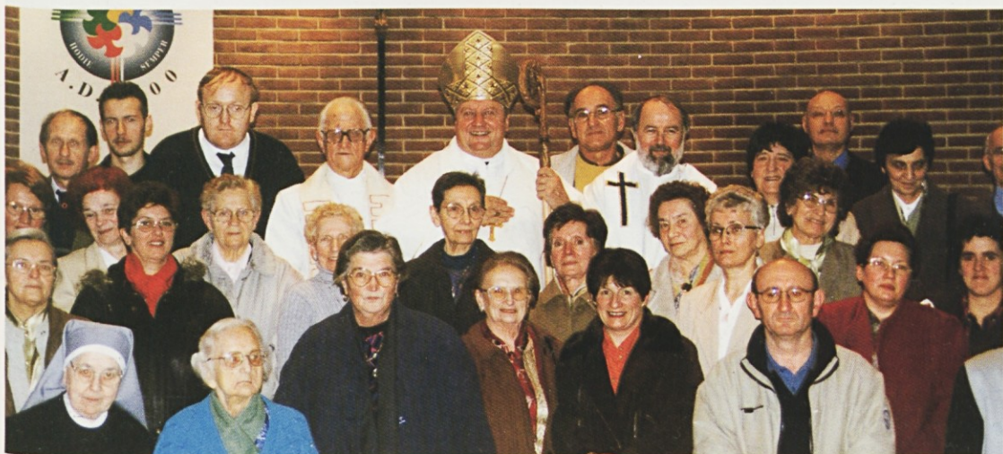
Ob škofovem obisku v Charleroiju