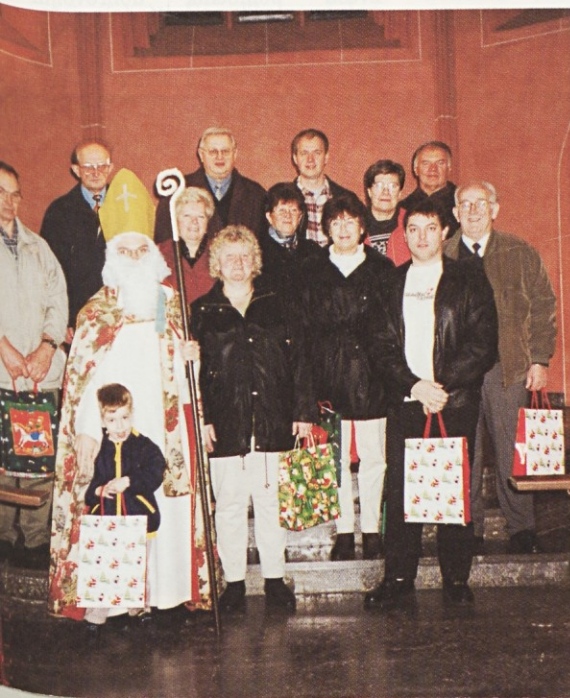
Miklavž je obiskal tudi skupnost iz Mainza.