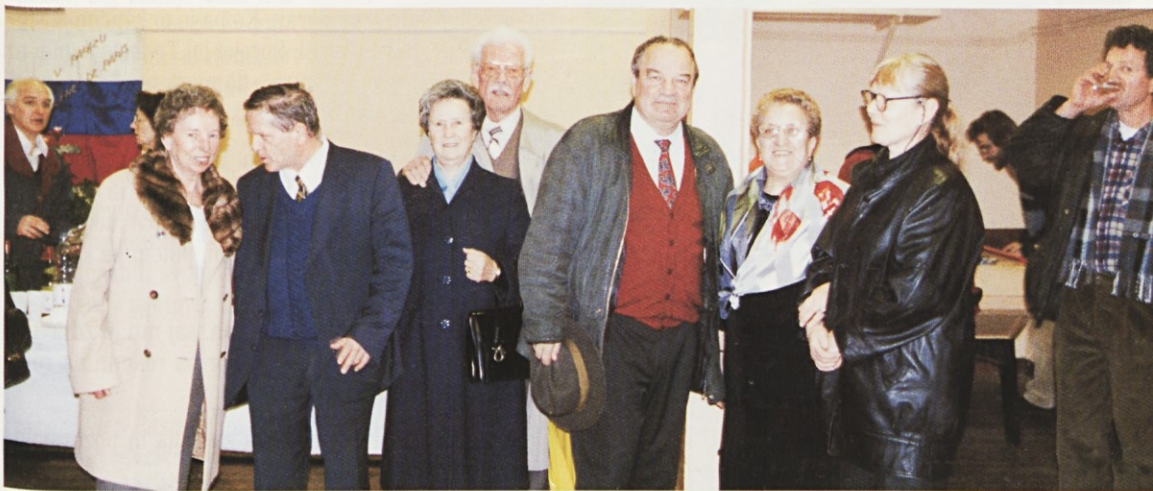
Slovenski rojaki iz Francije zbrani na slovesnosti posvetitve dvorane v Slovenskem domu v Parizu

“Vsak leto se vrača pomlad, toda občutek imam, da še nikoli ni bila tako lepa ali pa tega nisem videl, ker jo nisem imel tudi v srcu. Zagrenjen sem bil in ne vem, kako bi se vse skupaj končalo, če ne bi imel tako dobre sestre. Res se je zavzela zame in večno ji bom hvaležen. Saj tudi njej in njenemu možu ni lahko; oba hodita v službo in še otroke imata - zdi se mi, da bodo kmalu trije ... Ja, potem bo ona nekaj časa doma ...”