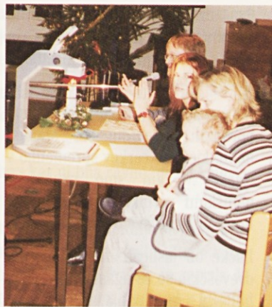
Pri tomboli so sodelovali tudi najmlajši.