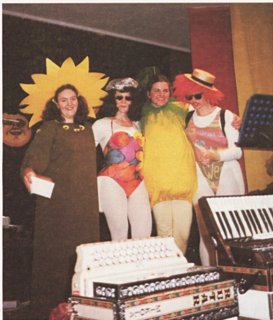
(Frankfurt) Pustovanje 2000 – nagrajene maske na gasilskem posnetku

“Saj navsezadnje je bilo to kar potrebno, da ne bom tako trd in neokreten, ko pojdem v službo. Danes je zadnja nedelja v aprilu in čez dober teden bom že šel prvič v službo. Veliko kilometrov bo treba prevoziti vsak dan in nič čudnega, da me to vedno bolj skrbi. Ja, brez skrbi pa res nisem nikoli ...”