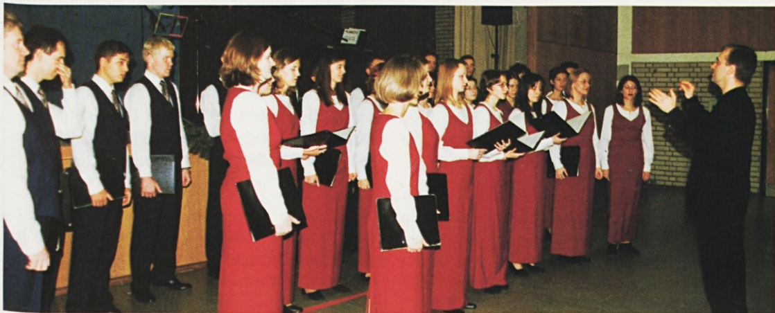
Akademski pevski zbor Tone Tomšič je v decembru izvedel zelo lep koncert v Stuttgartu.