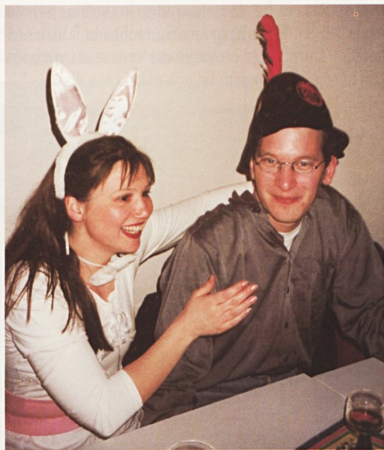
(Frankfurt) Pustovanje 2000 – zajčica in ...

Nasmehnil se je ob misli, kako je, namesto da bi kuhlal kosilo in raje je preizkušal kolo, ki ga je dal popraviti Janku, kakor mu je svetovala sestra.