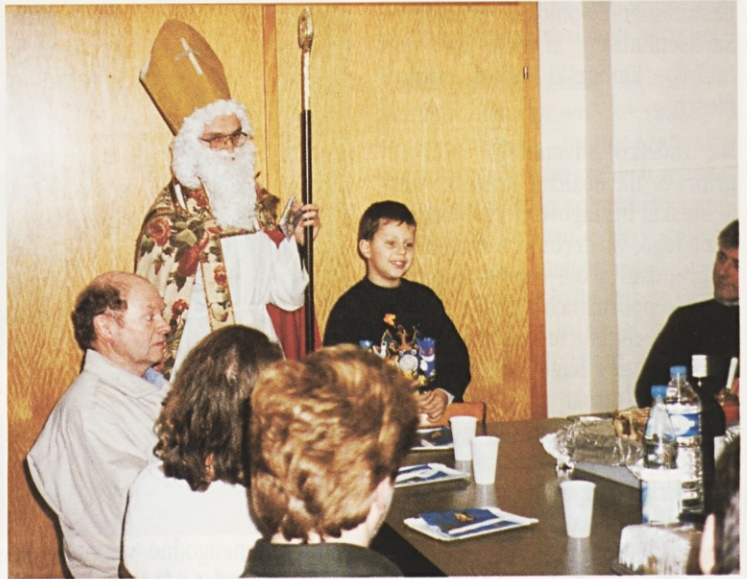
Tudi v Darmstadtu se najde kak otrok.