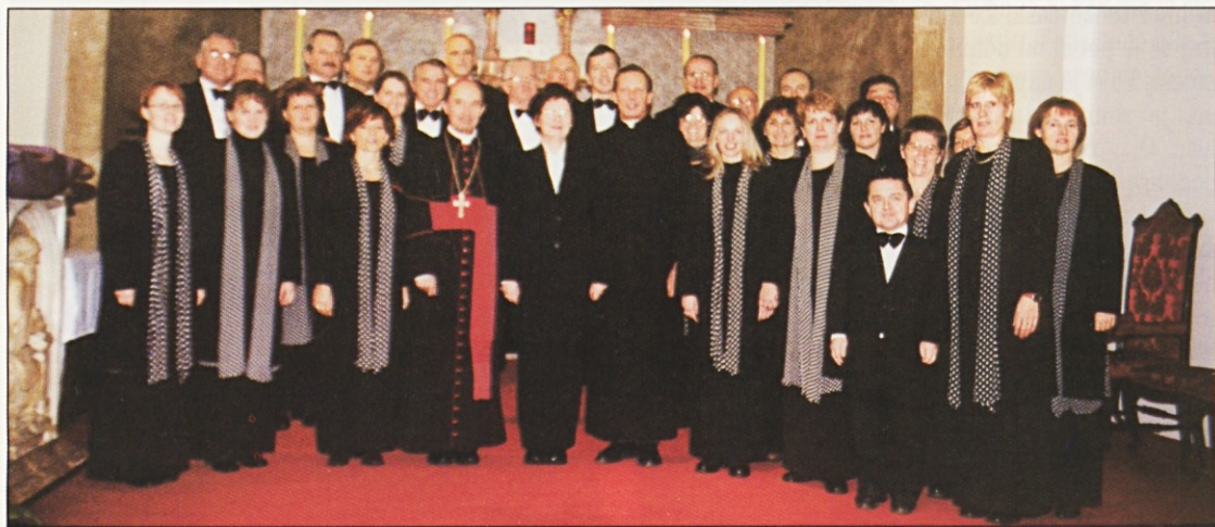
(Dunaj) Mešani komorni pevski zbor iz Celja se je želel slikati s škofom in župnikom.