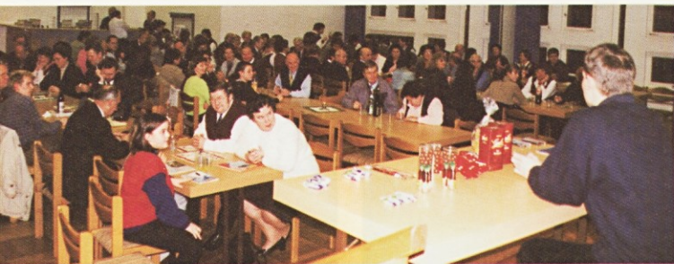
(Stuttgart) Božično srečanje in počastitev dneva samostojnosti

bogati, utrjuje v domačem jeziku, omiki in kulturi. Posebej smo mu posvetili nedeljo, 14. januarja, in priporočili Našo luč ob njenem zlatem jubileju.