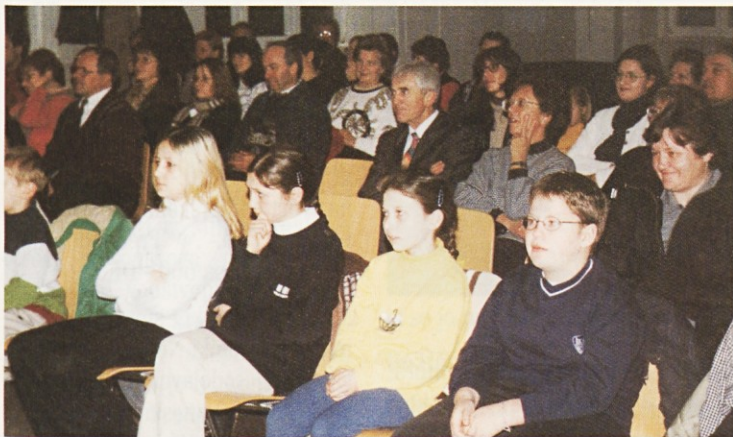
Miklavževanje privabi starše in otroke.