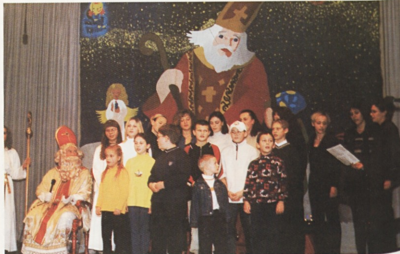
Miklavž v Münchnu sprašuje otroke.