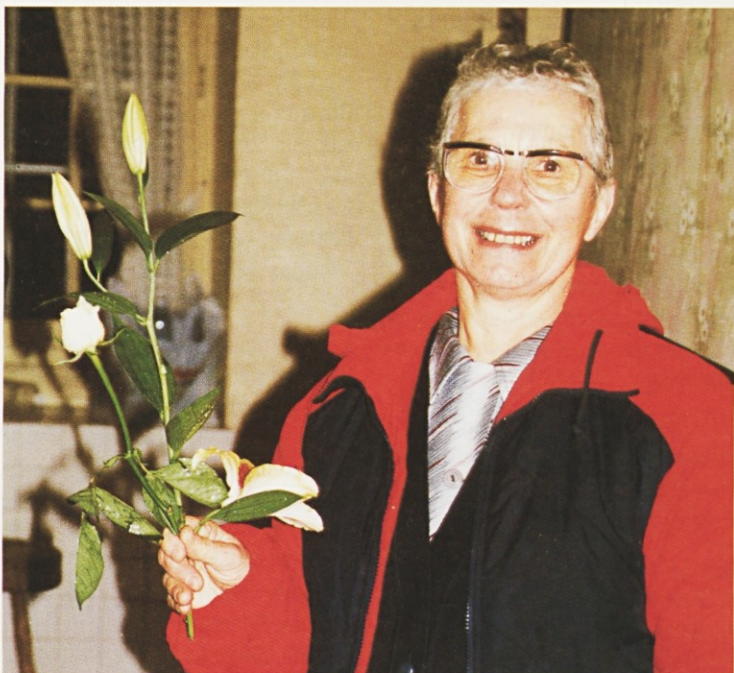
50-letnica prihoda sester v Morestel

Ko sva prišla k sestram, sva bila prijetno presenečena, saj je bila vsa hiša v pripravah na veliki praznik. Po daljšem klepetu sva obiskala še nekaj slovenskih družin, nato pa smo se zbrali v skupni jedilnici pri slavni večerji, kjer smo si ponovno imeli veliko povedati. Po večerji je sledil v cerkvi koncert: oratorij v čast svetemu Frančišku, ki ga je jubilantkam poklonilo združenje evropskih umetnikov. Oratorij ob zvokih 60 različnih instrumentov nas je povedel skozi pestro življenje svetega Frančiška in nam dal idej za današnji čas, ko postaja človek človeku volk. Nabito polna cerkev prijateljev in znancev je dolgo ploskala umetnikom, ki so nas povabili, da hodimo po stopinjah