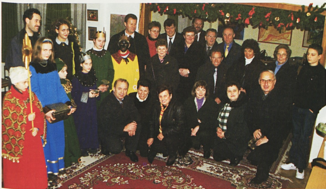
Ob novoletnem obisku kolednikov v Slovenskem domu v Stuttgartu

Nekateri bi kar zatisnili oči pred vso to pestro mejno problematiko, nekateri bi se morda celo odrekli članstvu v EU; ponekod morda razmišljajo, da bi morali pri približevanju EU počakati na Hrvaško, druge pa je mogoče strah, da Slovenija brez privolitve Hrvaške sploh ne bi mogla postati članica EU. Ta strah je po Ruplovih besedah votel: prvič zato, ker med Slovenijo in Hrvaško dejansko ni obmejnega spora, ampak le nedokončano tehnično opravilo ugotovitve in označitve meje v naravi, drugič zato, ker so tako imenovani mejni problemi za Hrvaško najmanj enako veliki kot za Slovenijo, tretjič pa zato, ker imajo podobne ali večje probleme tudi druge članice EU, je zapisal Rupel.