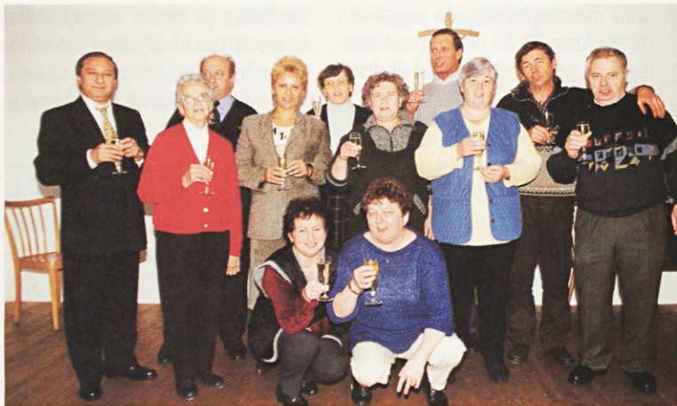
Pred polnočjo so Dunajčani po dobri večerji nazdravili s šampanjcem in zapeli.