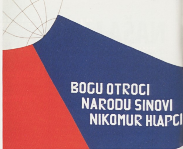
Zastava slovenske župnije v Stuttgartu

Upanje pa je dejanje, s katerim človek že dosega srečno prihodnost. Upanje je izvir moči in daje smisel našim dejanjem.