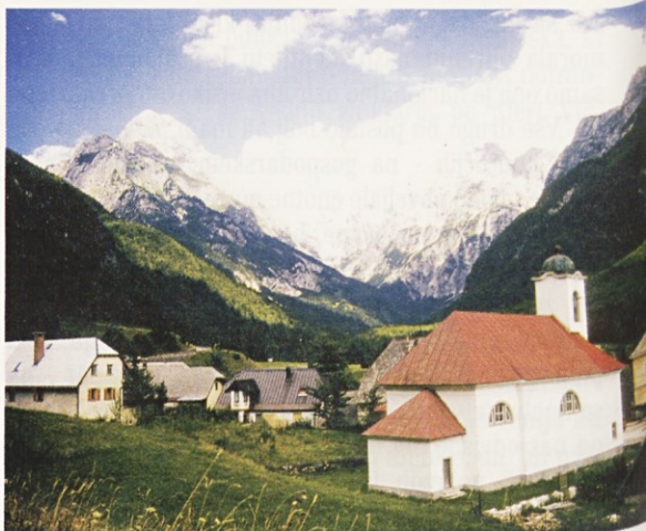
Tako je bilo nekoč... in danes

Iskreno se zahvaljujemo vsem, ki ste se odzvali in pomagali ljudem v stiski.