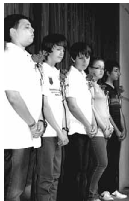
Osmošolci se poslavljajo

Prišel je trenutek predstave. Na odru so se pojavili zvončki, trobentice, prileteli so še metuljčki in pikapolonice, najmlajši naše šole. Pripravljali so se na počitnice; tako tudi otroci. Saj vemo, da je to najlepši čas, ker ni nalog, ni treba zgodaj vstajati, niti se učiti, itd. Narava pa nas vabi k občudovanju lepote in uživanju trenutkov v prijateljski družbi. Dva učenca sta si mislila, da šola ni potrebna. Hotela sta se skriti v gozdu, ko sta slišala recitacijo učencev 5. in 6. razreda »Dva potepena šolarja«. Eden izmed njiju se je premislil in jo kar hitro je pobrisal v šolo. A usoda ga je doletela na mostu, kjer ni bilo prostora za dva. Tam se je