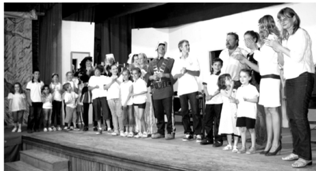
Pozdrav vseh nastopajočih