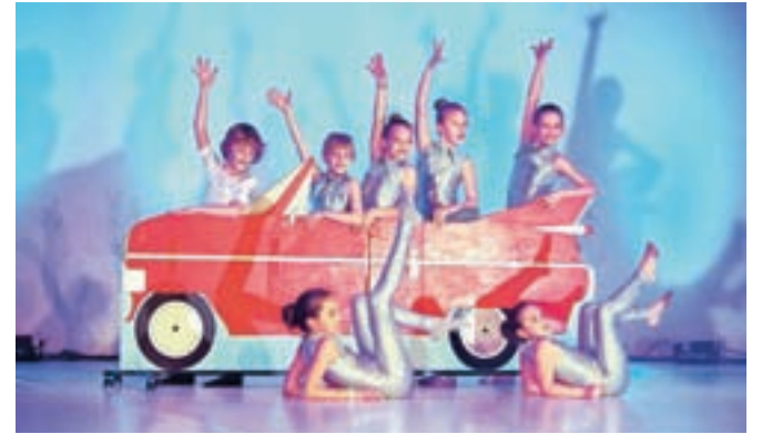
Na četrti Finesi plesa so se predstavili plesalci štirih kamniških in dveh trziških plesnih skupin.