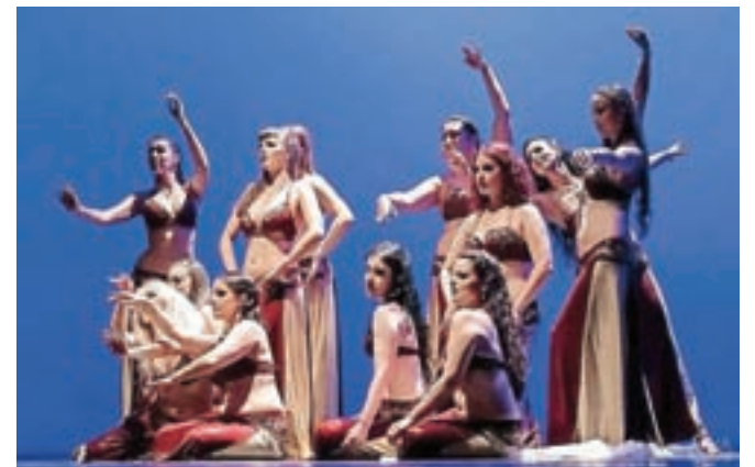
Plesalke KUOD Bayani na dunajskem odru