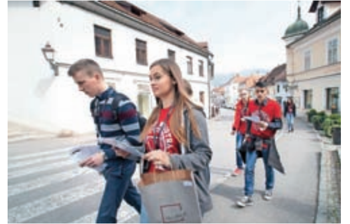
Na ekonomijadi se je pomerilo 24 ekip mladih ekonomistov iz vse Slovenije.