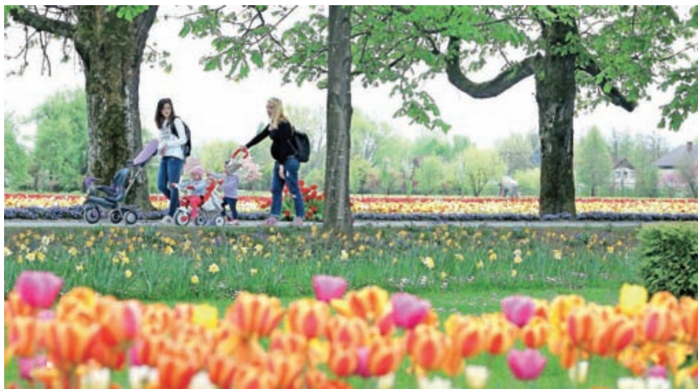
V Arboretumu v teh dneh cveti na tisoče spomladanskih cvetov.

V Arboretumu bodo jutri odprli tradicionalno razstavo spomladanskega cvetja, že 25. po vrsti. Na ogled bo do 2. maja, tudi po tem pa v parku zanimivih stvari ne bo manjkalo.