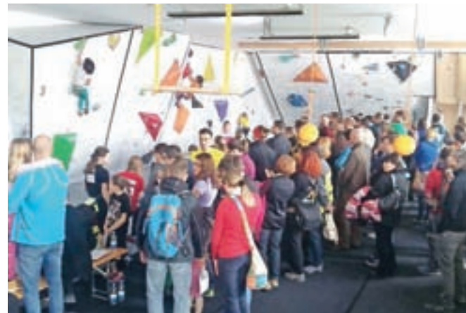
Plezalni center v starem Alpremu je bil poln nadebudnih plezalcev.

To je letos izkoristilo 284 tekmovalcev v desetih kategorijah ter njihovih spremljevalcev in staršev iz več kot dvajsetih plezalnih klubov od Sežane do Jesenic. Plezalni center v starem Alpremu je bil poln nadebudnih plezalcev od jutranjih ur do poznega večera. Med klubi iz zahodne Slovenije je bil