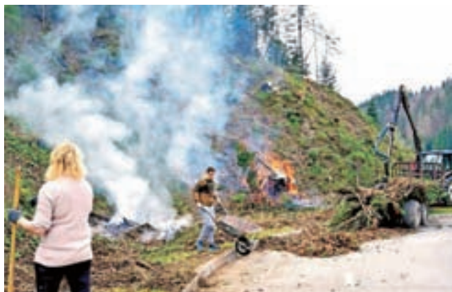
Na čistilni akciji v Snoviku so čistili tudi strugo potoka in brežino nad parkiriščem.

Srečanje s predavanjem in podelitvijo priznanj pa je bilo tudi uvod v čistilno akcijo naslednjega dne, ki je bila 2. aprila v Snoviku, Šmartnem v Tuhinju, Srednji vasi in okoliških krajih. Zbralo se je 44 čistilcev, deset jih je bilo iz Osnovne šole Šmartno v Tuhinju, devetnajst članov turističnega društva, petnajst pa zaposlenih in gostov iz Term Snovik. Čistili so potok, brežine nad parkiriščem, strugo potoka in ribico iz šibja – simbol term pri parkirišču; obnovili so ji »kožo in plavuti« z novim šibjem.