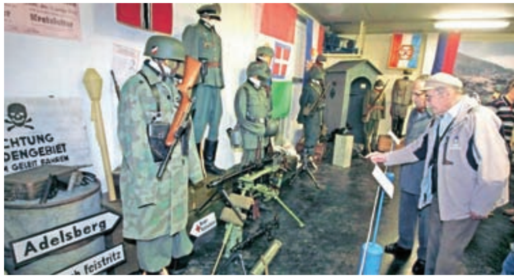
Vojni muzej Triglav je že ob odprtju privabil številne obiskovalce, v prihodnje pa ga bodo odprli po predhodnem dogovoru.