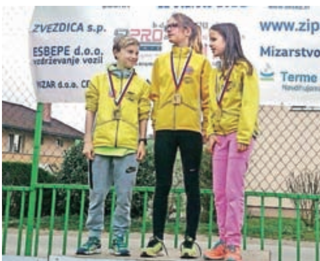
Deklice KGT Papež so znova postale državne prvakinja v gorskem teku za štafete.