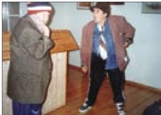
Gledališka skupina Veseli pajdaši je zošpilala igro z naslovom Volitve