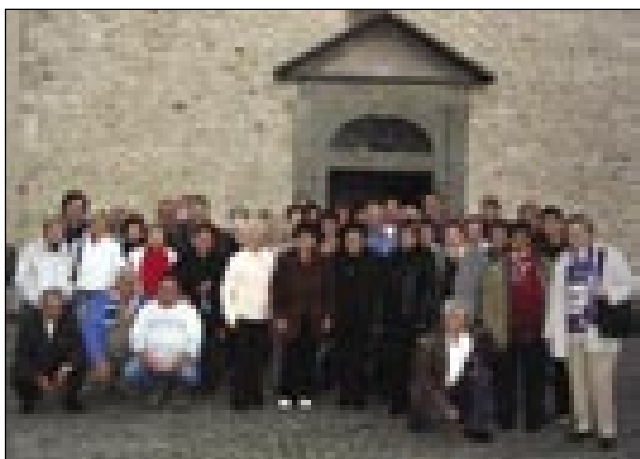
Prauškarge pred cerkvijo sv. Elizabete