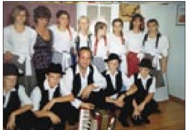
Otroška folklorna skupina ZS DOŠ Števanovci