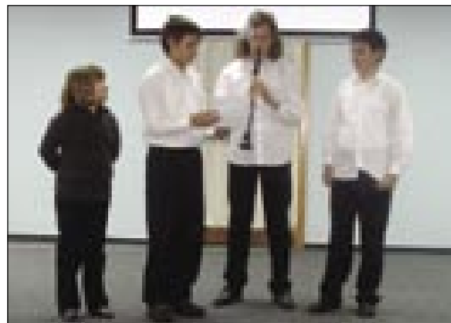
Učenci dobrovniške šole so sestavili zanimiv program

Učenci treh šol so pripravili kulturni program, ki je bil raznolik in zanimiv, kajti zavedati se moramo, da šole z nizkim števi-