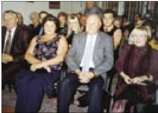
Gostje in člani društva

Oktobra je tradicionalni slovenski den pri Slovenskem društvu v Budimpešti. Na te