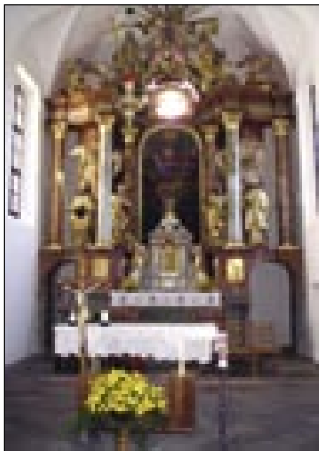
Oltar v cerkvi sv. Düha na Ostrom vrhi

co Marijo vküper z apoštolami na tistom mesti, gde je Jezuš slejdnjo večerjo emo s svojimi vučenikami pa ustanovo euharistijo. Na lejvom stranskom oltari Devica svojega sineka drži na rokaj, na desnom kraji na stranskom oltari so pa trgé angelge, sv. Mihael, Gabriel pa Rafael. Na predganci (prižnici) so pa štirge evange-listi, ki so sveti evangelium razlagali po smereh neba (a négy ég-táj felé). Ta cerkev je do 1892. leta slišala k graški (grazi) škofiji, od tistoga mau se drži