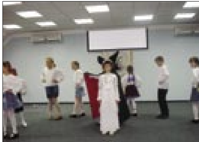
Mala folklor števanovske šole je zaplesala tudi »Trnuljčico«

Zapel je tudi pevski zborček iz šalovske šole, v programu katere je bilo zanimivo prisluhniti