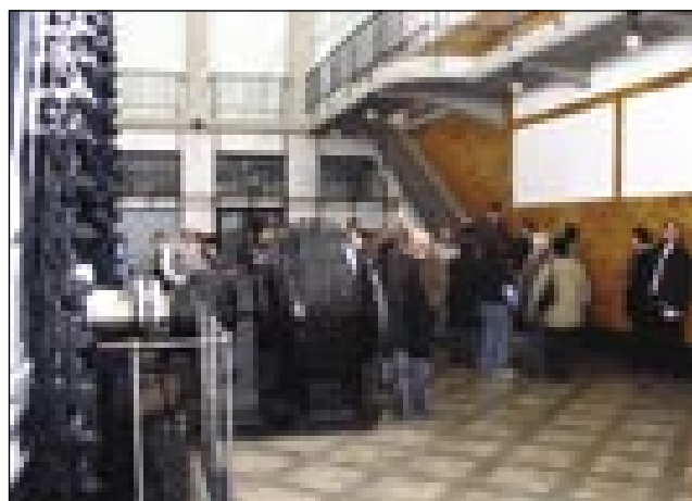
V hidroelektrarni Fala

v mariborsko püšpekijo. Z brega, na sterom stoji cerkev, smo vidli taprejk v Avstrijo. Če je lejpi čisti cajt, se vidi vse do Graca. Srečali smo se s Štajerami (Avstrijci), ka so šli k svetoj meši. Vsakši keden v soboto se v tej cerkvi slüži sveta meša v nemškoj rejči. Župnik je nej doma bijo, ka je z romari na prauško išo v Rim, zatok nam je od cerkve gučo kaplan. Potejm smo se odpelali pa smo si poglednili Hidroelektrarno Fala, (vízierömü), stero so začnili zidati 1913. leta, končali so zidanje 1918. leta, gda je začnilo delati prvi pet agregatov.