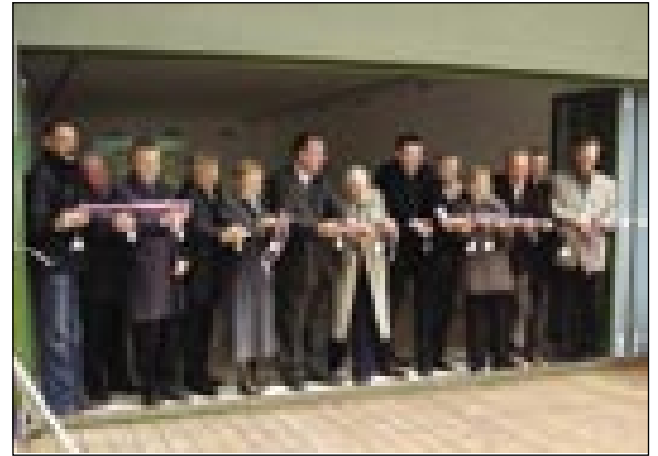
Tako so prerezali trak – slovensko zastavo – in slavnostno odprli Raziskovalno postajo ZRC Prekmurje na Šiftarjevi domačiji v Vrtu spominov in tovarištva na Petanjcih.