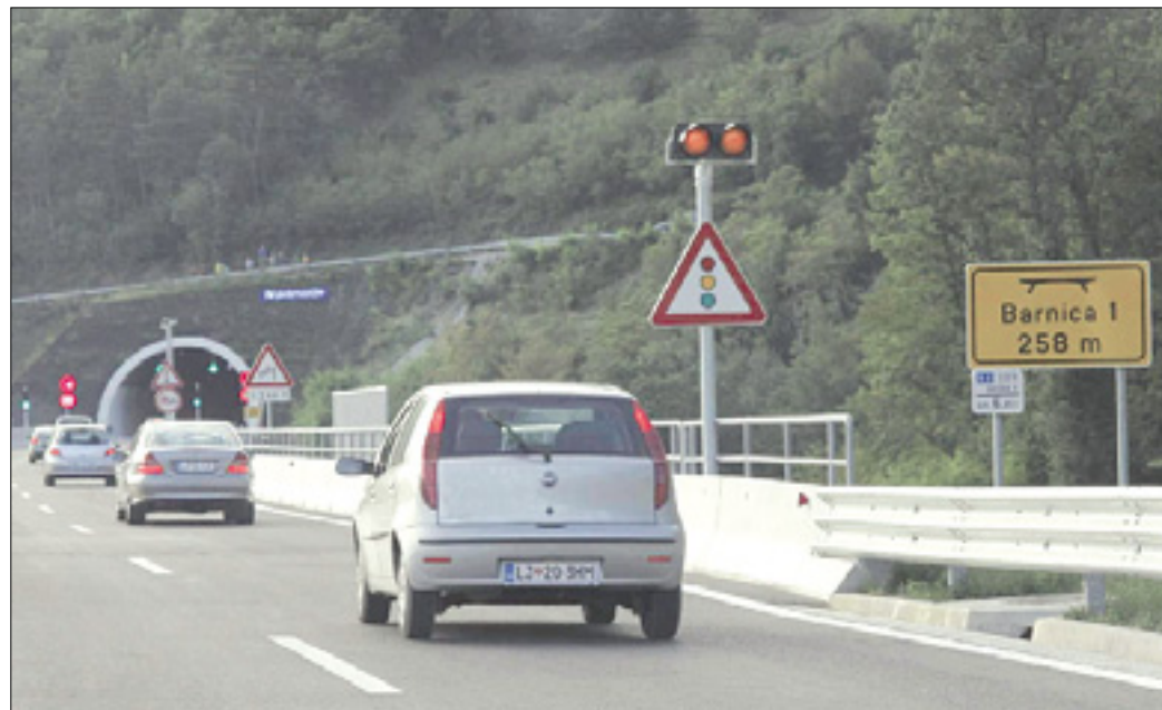
Automobili na novem odseku pri Rebernicah

Zaradi okvare tovornjaka promet začasno speljali po prehitevalnem pasu