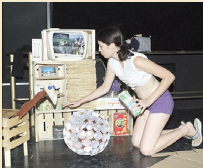
Izdelovanje dnevne sobe

Dvajset mladih iz Latvije, Portugalske, Avstrije, Italije in Slovenije se je teden dni ukvarjalo s problematiko varstva okolja