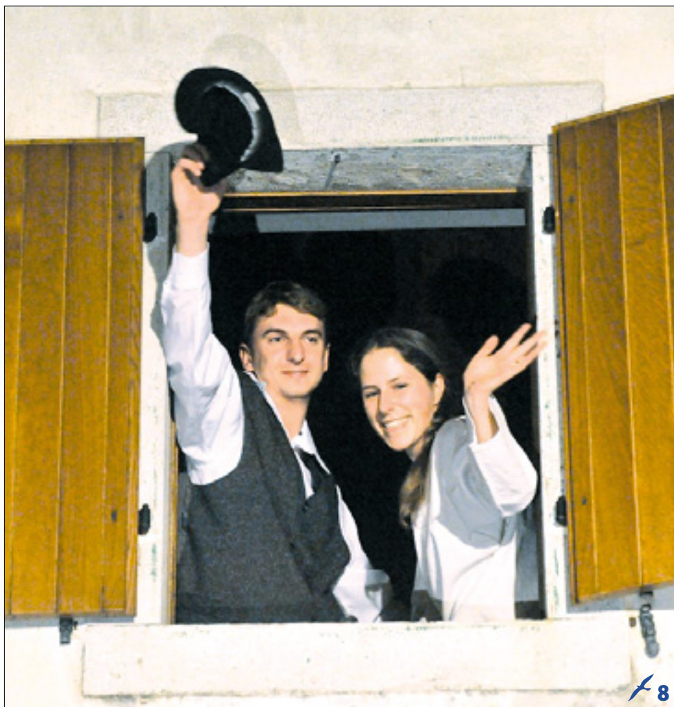
Dean in Ivana sta veselo pozdravljala z okna