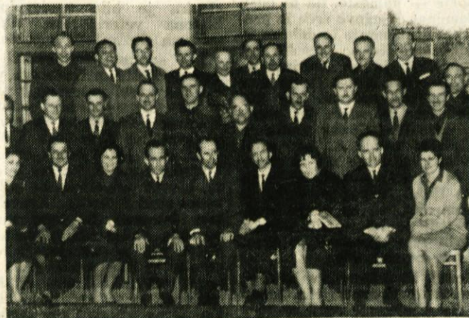
Polovici članom stare občinske skupščine je aprila potekel dvoletni odborniški mandat. Zastopniki političnih ter družbenih organizacij in občinske skupščine so se jim zahvalili za opravljeno delo na posebni slovesnosti. Na sliki odborniki, ki jim je potekel mandat

Še v istem mesecu se je skupščina sestala na svojo tretjo sejo, katere osrednja točka je bila razprava in sprejem urbanističnega programa za vplivno območje Domžal. Program je bil razgrnjen in dan v javno