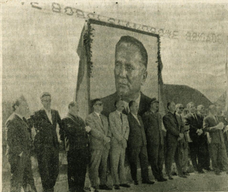
Ob proslavah v spomin na zgodovinske dni narodnoosvobodilne borbe se sestajajo nekdanji borci in sedanji graditelji socializma, pred očmi pa jim je neprestano herojski lik tovariša Tita. Njemu veljajo tudi naše čestitke za njegov 73. rojstni dan

Samoupravljanje omogoča usklajevanje individualnih materialnih in moralnih teženj s splošnimi družbenimi in s tem predstavlja vzvod za najhitrejši razvoj materialne podlage družbe in rast socialističnih odnosov.