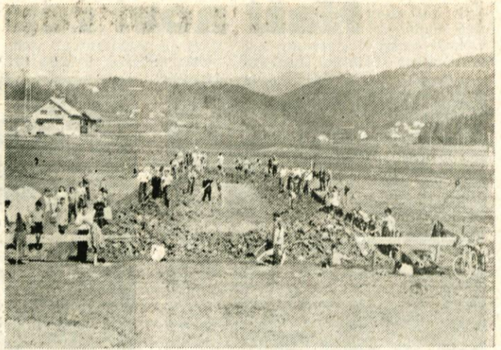
S prostovoljnim delom so Moravčani pričeli graditi obrat »Rašice«, v katerem dela sedaj v higienskih prostorih že 140 delavk

Tako je delovni kolektiv, ki je najmlajši v občini, prišel