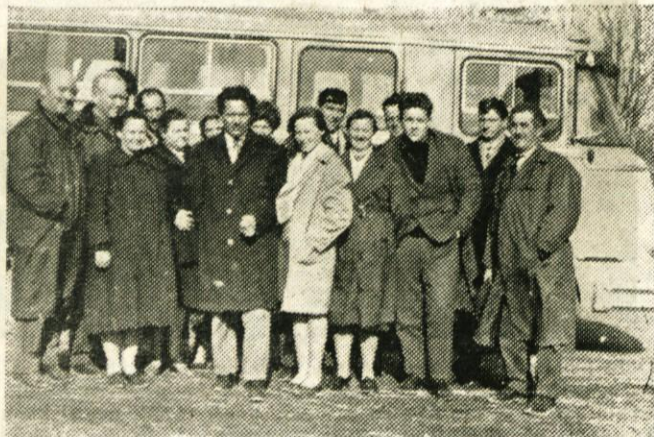
Skupina krvodajalcev iz Moravč pred odhodom na odvzem krvi