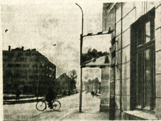
Križišče Kamniške in Ljubljanske ceste v Domžalah je zelo nepregledno in zato nevarno. Da bi bil promet varnejši, je komisija za varnost prometa namestila na križišče posebno ogledalo, ki povečuje preglednost. Zeleti je, da bi to ogledalo dolgo časa služilo svojemu namenu

5. in končno proučevanje gradiva je treba povezati z vsakodnevno prakso, z revolucionarno uporabo kongresnega gradiva na delovnem mestu in v okolici, kjer živimo.