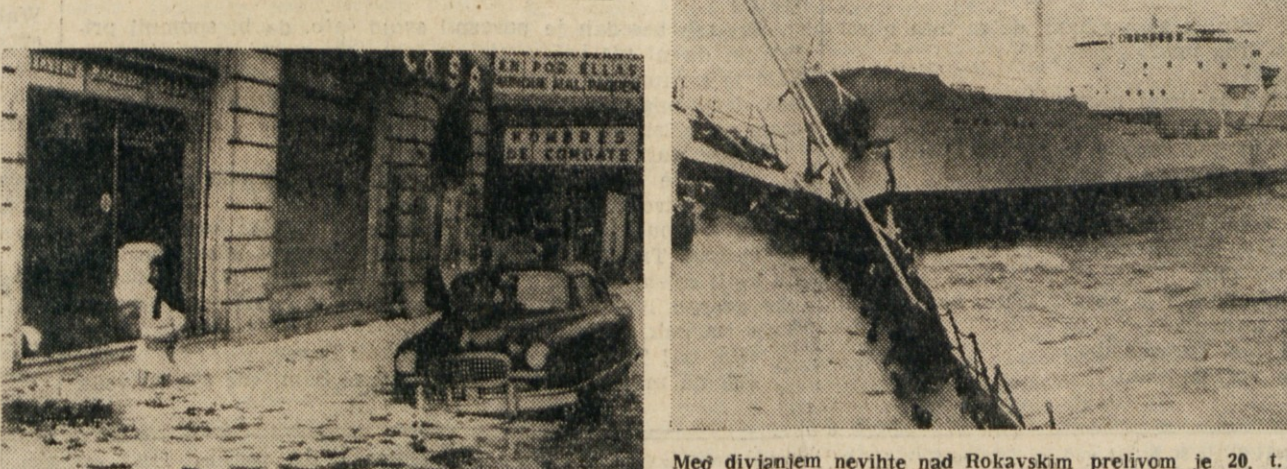
Med divjanjem nevihte nad Rokavskim prelivom je 20. t. m. tretila ameriška tovorna ladja „Nestern Farmer“ v norveško cistermsko ladjo „Borgholm“... Kljub takojšnji pomoči, se je ameriška ladja kmalu potopila