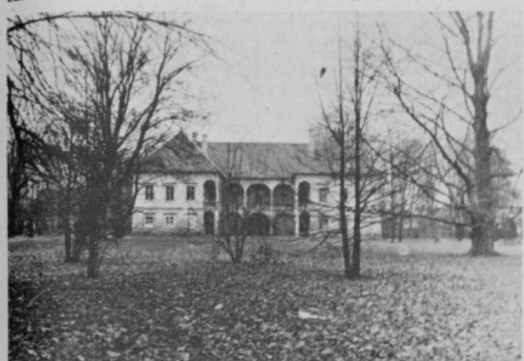
450 let stari grad služi za učne prostore Poklicne poljedelsko-živinorejske šole v Turnišču

Najprej naj omenim, da je zgradba, v kateri živimo, stara že 450 let in da že sami prostori ne ustrezajo uspešne-