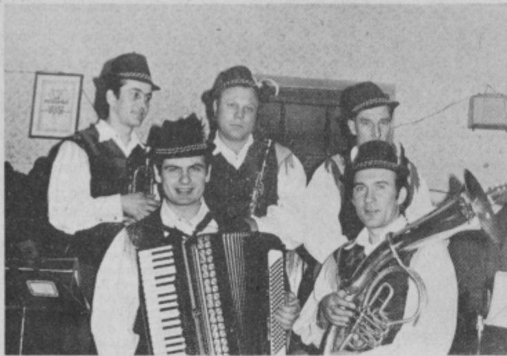
To so Dravski potepuhi

Že večkrat smo poročali, da so na kakšni prireditvi v Hajdini skrbeli za razvedrilo in ples Dravski potepuhi. Ob neki priložnosti me je nekdo vprašal, kakšni so ti potepuhi, ki jim je Hajdina tako pri srcu.