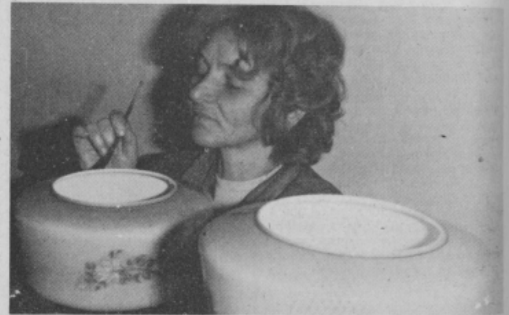
Stekloslikarka na svojem delovnem mestu v bistriški Steklarni.