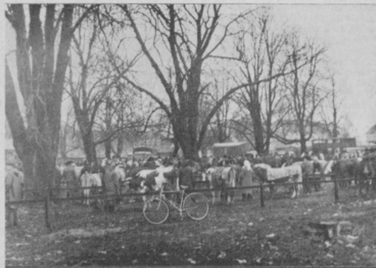
Na zadnjem živinskem sejmu v Ptujju je bilo živahno

Prejšnji petek, prvi petek v tem mesecu, je bilo na ptujskem sejmišču zelo živahno. Kupcev in prodajalcev je kar mrgolelo in tudi živine, kljub slabemu vremenu, ni manjkalo, saj je bilo na sejmu nad 184 goved in konj ter 15 telet. Razen nekaj krav in konj pa je bila kvaliteta živine zelo slaba in imel sem občutek, da morajo prodati živino zaradi slabega lanskega pridelka krme.