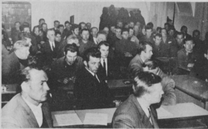
Kmetje so napolnili dvorano.

Kmetje s področja ormoške občine so minulo sredo imeli izjemno priložnost seznaniti se z delom kmetijske mehanizacije, ki tudi na ormoško področje prodira z velikimi koraki. Strojno industrijsko podjetje (SIP) Šempeter v Savinjski dolini je skupaj s Kombinat HMEZAD Zalec predstavilo kmetom linijo strojev za spravo krme. Pri organizaciji je sodeloval tudi Kombinat „Jeruzalem“ Ormož. Strojno industrijsko podjetje ali kratko SIP Šempeter izdeluje po licenci znane avstrijske firme Poettlinger stroje za spravo sena. Kmetijski kombinat HMEZAD Zalec pa je generalni zastopnik omenjene firme za področje Jugoslavije.