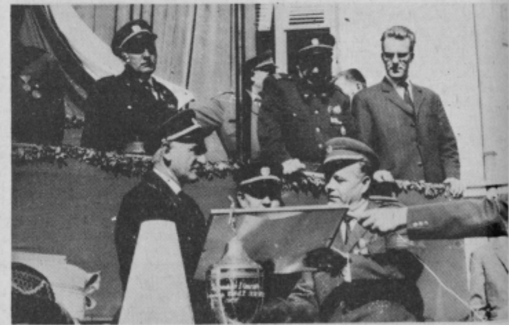
Posnetek s proslave 95-letnice društva