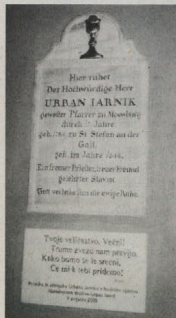
Spominska plošča Urbanu Jarniku

V času Jarnikovega službovanja je skozi Možberk tekla slovensko-nemška jezikovna meja. Jarnik, leta 1784 rojen na Potoku na Zilji, je kot duhovnik