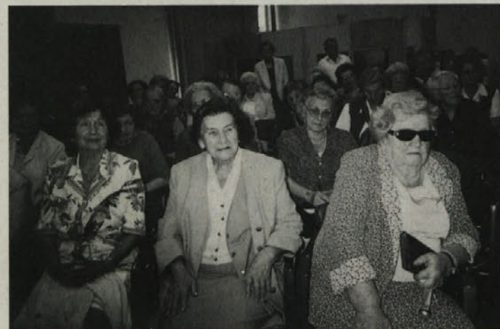
Udeleženke srečanja v Portorožu

OPOZORILO: V Železni Kapli je bilo konec tedna prav tako srečanje biših internirank iz Ravensbrücka. Poročilo bomo objavili prihodnji teden.