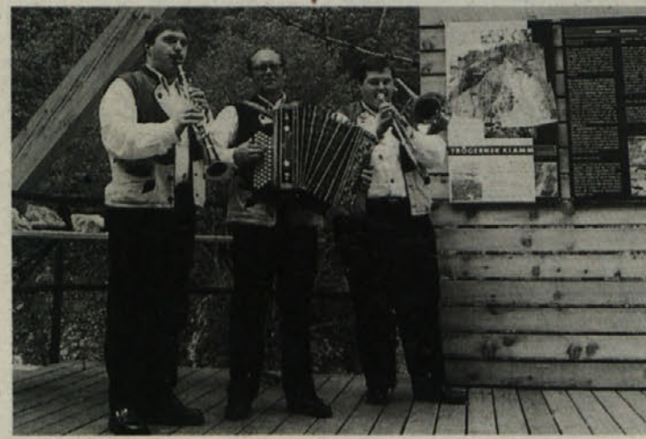
»Trio Pegrin« je olepšal slavnostno otvoritev projekta

Slavnostna otvoritev s pozdravnimi nagovori častnih gostov je bila pri gostilni »Francel« v Kortah, slavje pa sta olepšala »Trio Pegrin« in MePZ upokojencev iz Železne Kaple.