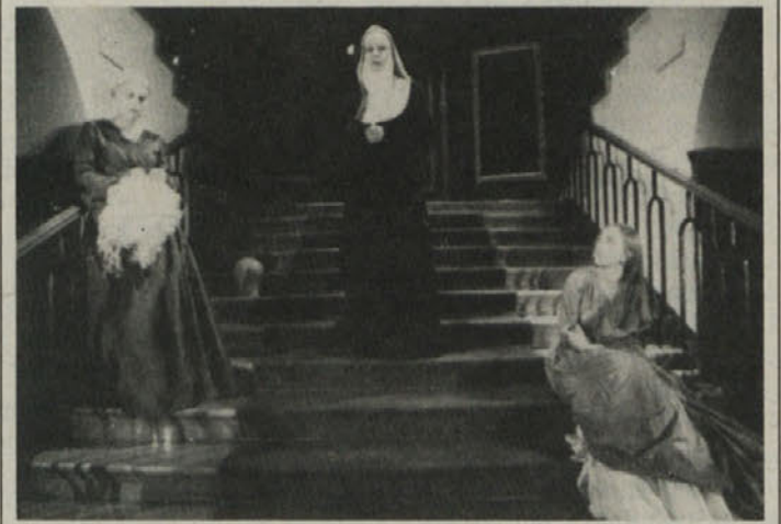
Po francoski revoluciji – kaj pa zdaj?