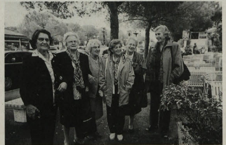
Bivše taboriščnice iz istega bloka imajo še danes intenzivne kontakte