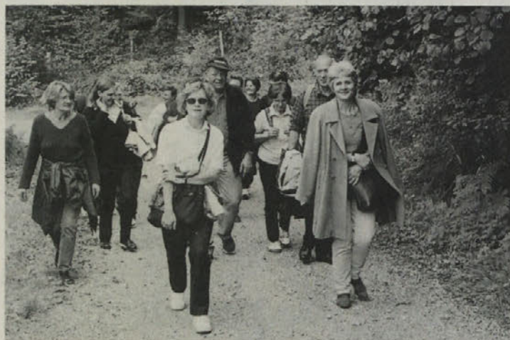
Pot je vodila navkreber do Razpotnika v Podgorjah

Na svečnico pred 169 leti, to je bilo 2. februarja 1832, sta se takratni spiritual v celovškem bogoslovju (in poznejši lavantinski škof ter zdaj že svetnik) Anton Martin Slomšek, in odvetniški pripravnik (in prvak slovenskega pesništva) France Prešeren, oba sta se poznala še iz dijaških let, podala na pot iz Celovca v Blatograd ali Možberk. Obiskala sta tamkajšnjega duhovnika, sicer pa občje znanega znanstvenika, slavista in velikega Slovana Urbana Jarnika.