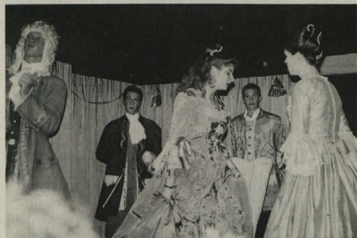
Ženina, nevesti in obupani stremuški oče