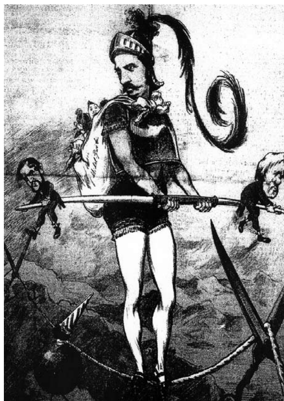
Cislajtanski ministrski predsednik grof Eduard von Taaffe (1833-1895) kot politični vrvohodec.