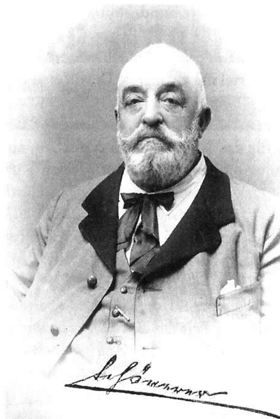
Vodja vsenemških poslancev Georg von Schönerer (1842-1921).