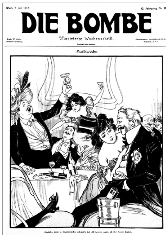
Dunajsko nočno življenje kot vnetljiva mešanica denarja, vpliva, alkohola in pohote. (Die Bombe. Illustrierte Wochenschrift, 7. 7. 1912)