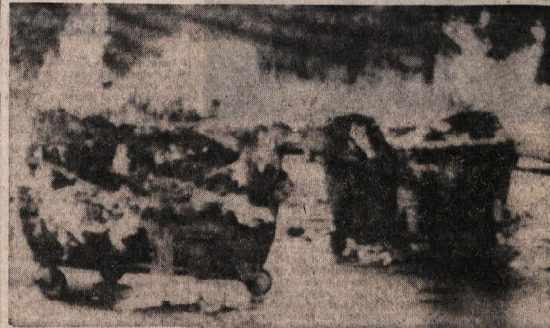
V Padovi so tako imenovani avtomobilisti zažgali nekaj vozil, poleg več desetih avtomobilov