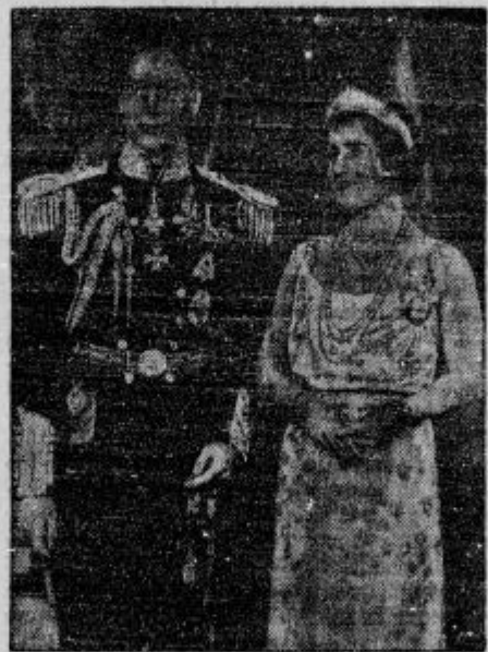
Angleški kralj Jurij VI. in njegova soproga Elizabeta ki sta po odstopu Edvardovem zasedla angleški prestol, se bosta dala maja meseca v Londonu slovesno kronati

Je zaupnike, seveda tudi žide, ki naše nadzirajo. To tembolj, ker si on, glavni dobičkar, ne upa v Jugoslavijo, da s tem ne bi vzbudil sum, da ima zveze z ljubljansko