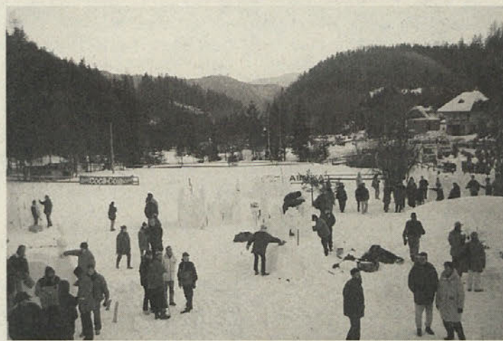
Ob gostilni Pri Matjažu je nastalo osemnajst gradov. Najboljše je razglasil legendarni kralj Matjaž v spremstvu Alenčice

»Življenje brez praznikov je kakor cesta brez gostiln«, pravi pregovor. V Mežiški dolini je gostiln sicer že od nekdaj precej, le kakšen praznik več, ki bi razveseljeval domačine in turiste z novci, bi bil še dobrodošel. Da je to še kako res, je znova dokazala prireditev v pogorju Pece »Snežni gradovi kralja Matjaža«, ki se povezuje z legendo o spečem ljudskem junaku Matjažu, Alenčici in vojščakih, tokrat že peta po vrsti. Potekala je prvi februarjski konec tedna v čudovitem vremenu na snežni planoti nad nekdanjim rudarskim naseljem Helena. Tam so ves dan nastajali snežni gradovi, ki jih je okrog sto navdušencev v osemnajstih ekipah gradilo iz snega, ledu in vode. Prišli so iz raznih krajev Slovenije, posamezniki pa tudi iz Avstrije, Irske, Madžarske, Turčije in Hrvaške. Pet do sedemčlanske ekipe so morale predložiti skico gradu, uporabljali pa so le ročno orodje od žage do žlice. Osnovni elementi so bili seveda snežni zidaki in ob-