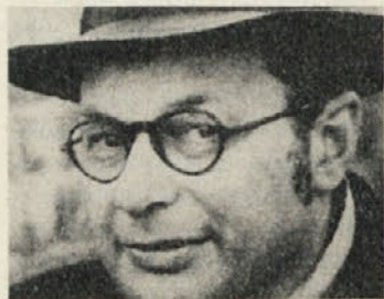
Pozabljeni pesnik Theodor Kramer

Besede pesnika Theodorja Kramerja niso veljale samo v težkih vojnih časih, ko je pred nacisti zbežal v Anglijo. Veljajo še danes. Njegov stoti rojstni dan so 28. januarja t.l. praznovali v dunajski Uraniji, adoraciji pa so organizirali avstrijski Pen-club, »Theodor Kramer Gesellschaft« in Uranija. Pesnika iz Nižje Avstrije pozna in časti le peščica ljudi oz. zgolj našete organizacije, ki hranijo in objavljajo njegova dela kot literaturo pregnanstva in upora.