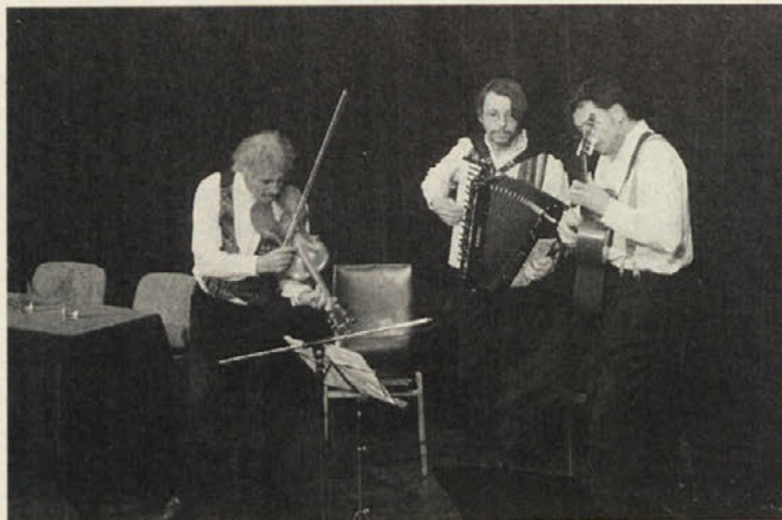
Skupina 10 Saiten 1 Bogen je uglasbila nekaj Kramerjevih pesmi, kar si je avtor vedno najbolj želel