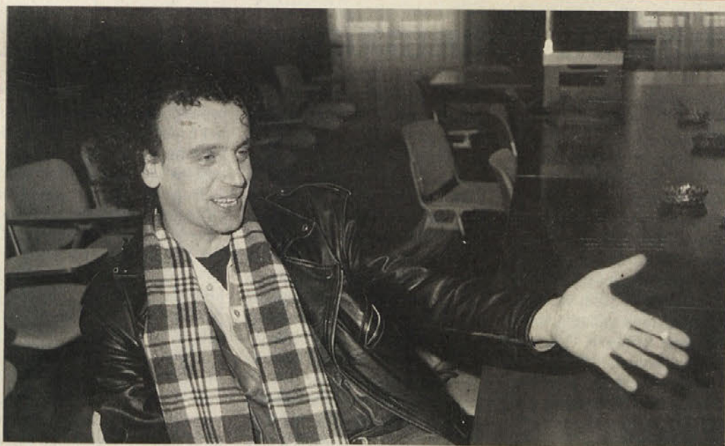
Režiser in plesalec Zdravko Haderlap bo predstavil občinstvu svoj pogled na svet z uporabo teksta Franza Xaverja Kroetza »Odstrel« (prevod Borut Trekman). Več o tem preberite na strani 5.