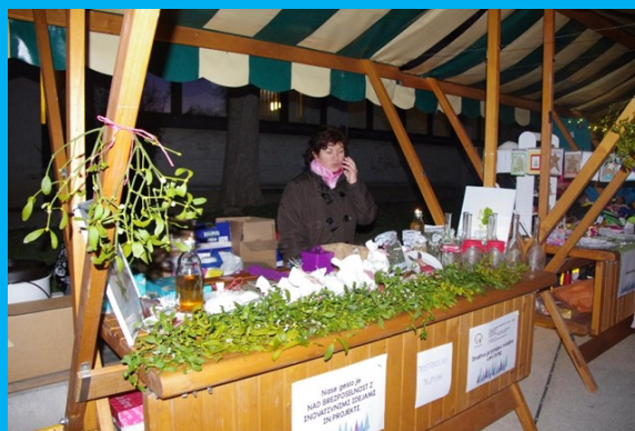
Stojnica na božičnem sejmu.

Društvo prijateljev mladine Levi breg - Velenje je bilo ustanovljeno in registrirano že prej, leta 1995, potem pa je prenehalo delovati. Organizacija je torej že obstajala, potrebno ji je bilo le vdahni dušo. Pa smo se dogovorili, kako in kaj. Vsi smo bili zelo zagnani, otroci pa najbolj. Skozi vsa ta leta smo bili pobudniki mnogih različnih aktivnosti. Pred 20 leti smo začeli orati ledino na področju ločenega zbiranja odpadkov in osveščanja o pomembnosti varovanja okolja skozi projekt Narava in varstvo okolja. Poznani smo po »zamenjevalnici dobrin«, ki smo jo razširili na »zamenjevalnico dobrin, spretnosti, znanj in veščin«. Vrata je odprla »zeliščarna«, prva brezplačna svetovalnica za varno uporabo zdravilnih rastlin za ljudi in živali. V drugi polovici letošnjega leta imamo predvidenih še veliko različnih projektov. Imamo ustvarjalne ideje, ki so realne in uresničljive. Praznujmo in se veselimo skupaj!