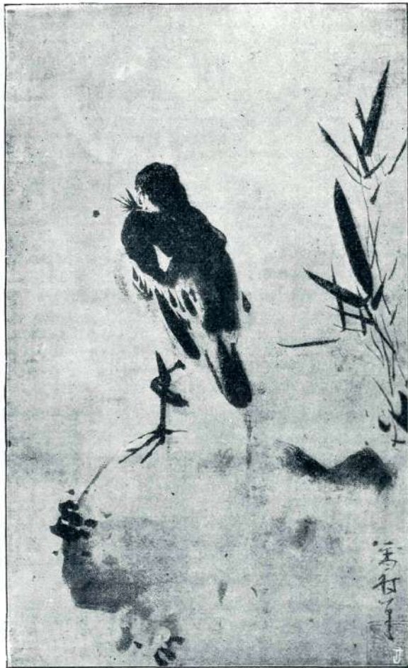
SESON (1480—1560), ŠKOREC.

LETNIK 38. V LJUBLJANI 1. MARCA 1925. ŠTEVILKA 1.