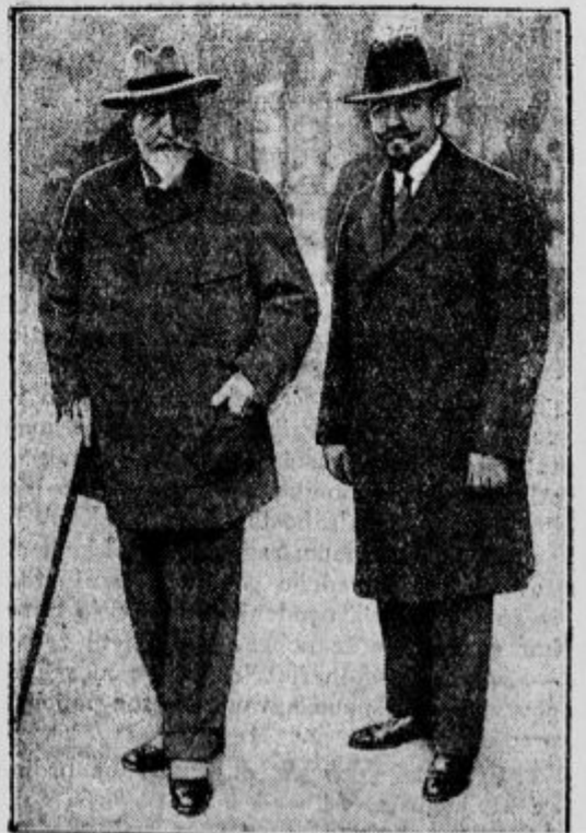
Dva št. bugarski kralj Ferdinand... ki se v spretnstvu svojega tajnika mudi v Berlinu. Ferdinand je sedaj star 68 let.

žona newyorskoga guvernerja Smitha, demokratskega kandidata za predsednika Združenih držav. Če bo Al. Smith izvoljen, bodo imele Združene države prvega katoliškega predsednika.