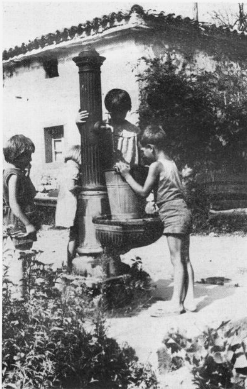
V Jelšanah tudi najmlajši dežurajo pri pipah

lagali, da bi se sestali predstavniki občine skupaj s predstavniki obeh vasi in da bi se domenili, da bo vsaka vas imela vodo. Medtem ko tiskamo naš časopis, še ne vemo, kako so se odločili in ali so našli skupen jezik. Naj bo tako ali tako, občina bi morala predvsem nemudoma zahtevati od koprške vodne skupnosti, da vodovod, ki so ga pred leti zgradili natančno pregledajo in nastalo napako čim prej odpravijo.