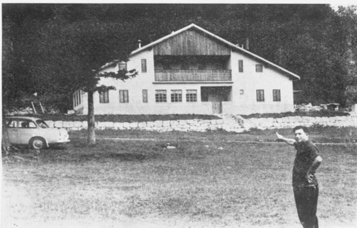
Planinski dom za zaprtimi vrati na Sviščakih