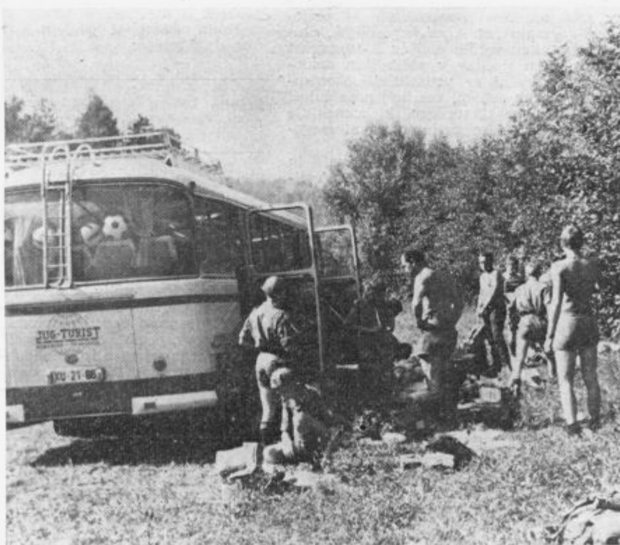
Čehi. Divji taborniki ob cesti