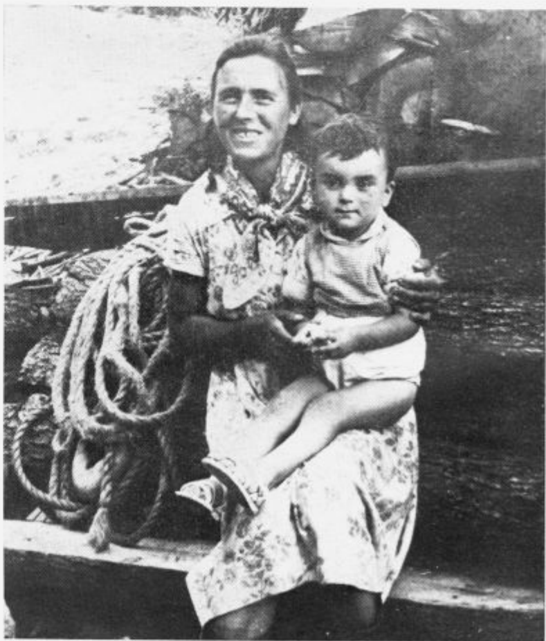
Dalmatinka v vasi Gornji Jemon

Domov sem prišel z družino. Tri otroke imam in ženo. Dva meseca bomo doma. Moji otroci znajo slovensko. Je pa tudi dosti otrok, ki jih starši ne uče slovenskega jezika. To ni niti dobro, niti pametno. Več jezikov znaš, več veljaš. Nikdar ne veš, kdaj ti kakšen jezik prav pride. Posebno pa domače govornice človek ne sme nikdar pozabiti. Če me moj otrok po slovensko ne vpraša, ne dobi kruha! Poslal jih bom v šole. Starejši že hodijo. Naj se učijo. Ko