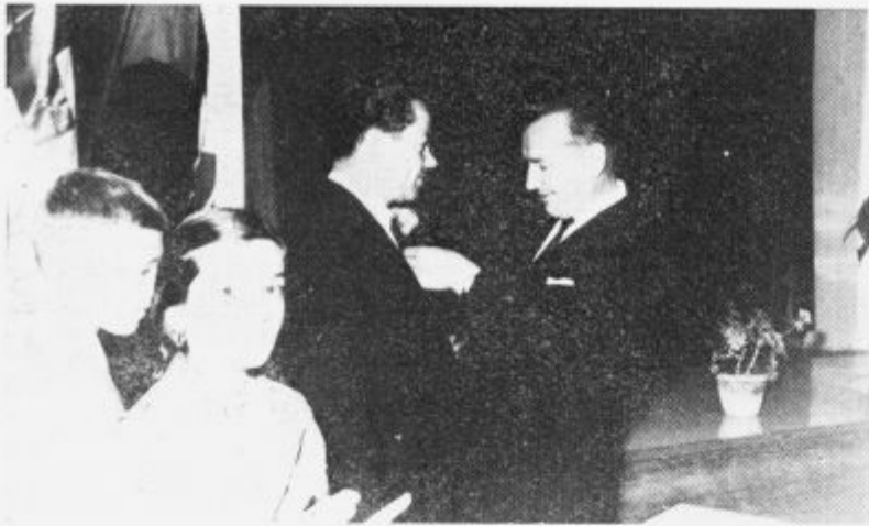
Predsednik obč. skupščine prejema zlato značko

Kot vsako leto, smo tudi letos pozdravili naše krvodajalce in jim priredili sprejem, na katerem je bilo odlikovanih 20 krvodajalcev z zlato in 75 s srebrno značko.