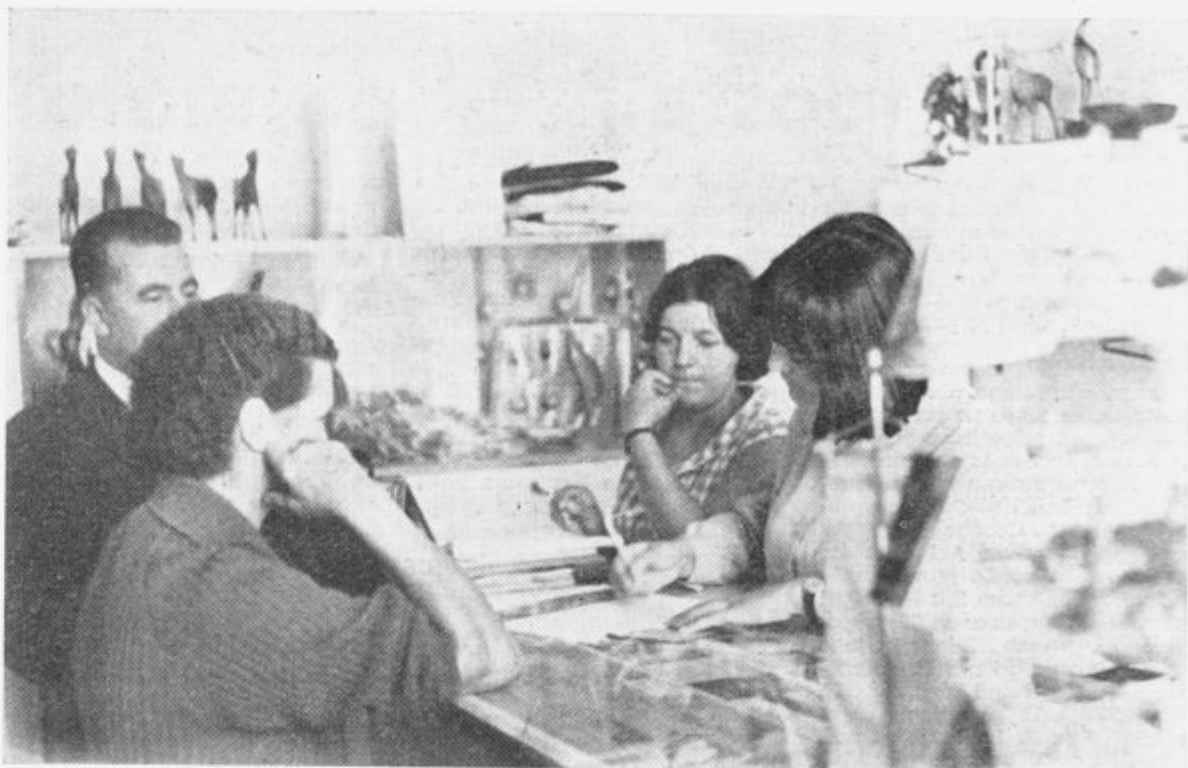
V turističnem biroju