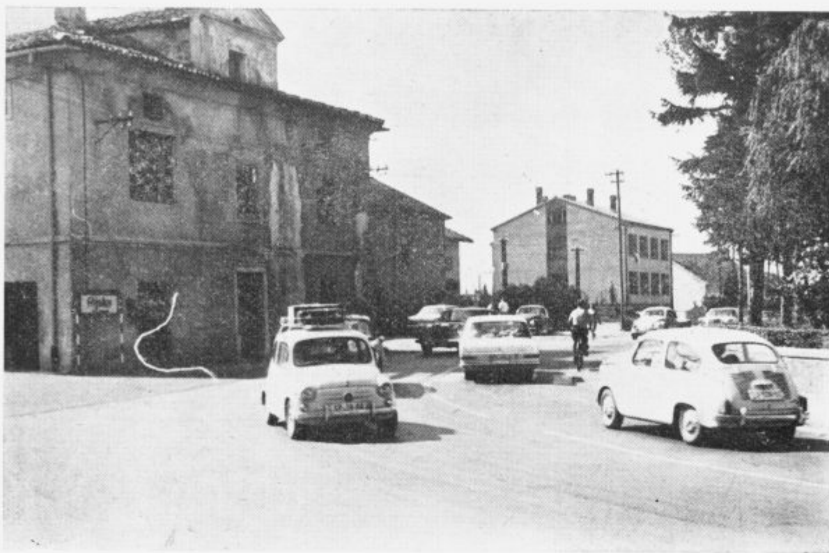
Na ovinku. Ilirska Bistrica v poletni sezoni