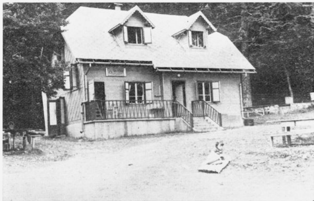
Odprto gostišče na Sviščakih — brez ležišč

mera. Vsak bo seveda pripeljal s seboj še ženo... V manj kot petih minutah razmišljanja se jih je nabralo petdeset. Gostom je treba nekaj nuditi, treba jih je dostojno sprejeti... to pa velja denarja, lepe denarje. Kje naj jih vzamemo? Najprej naj prosjaciimo za denar, potem pa slavnostna pojedina! Ljudje so se navadili, da se na otvoritvah zastonj je ter pije. Postalj so po osvoboditvi razvajeni. Podjetja so nas na Sviščakih obkrožila z vikendj. Mnogi bi k nam v naš planinski dom radi hodili le popivat. Proti temu se borim. Tega nočem in