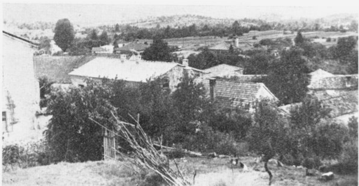
Jelšane — 340 prebivalcev brez vode

normativih (zahtevah). Tujci imajo dovoljen osni pritisk do 12,5 ton, mi gremo pa nazaj na 10 ton. Problem nismo začeli reševati pri cestah, kakor bi bilo normalno, temveč pri koristnikih kar ni dobro. Nam se bo to krepko poznalo,« je še dejal direktor, in se poslovil, ker se mu je mudilo na pot v Beograd.