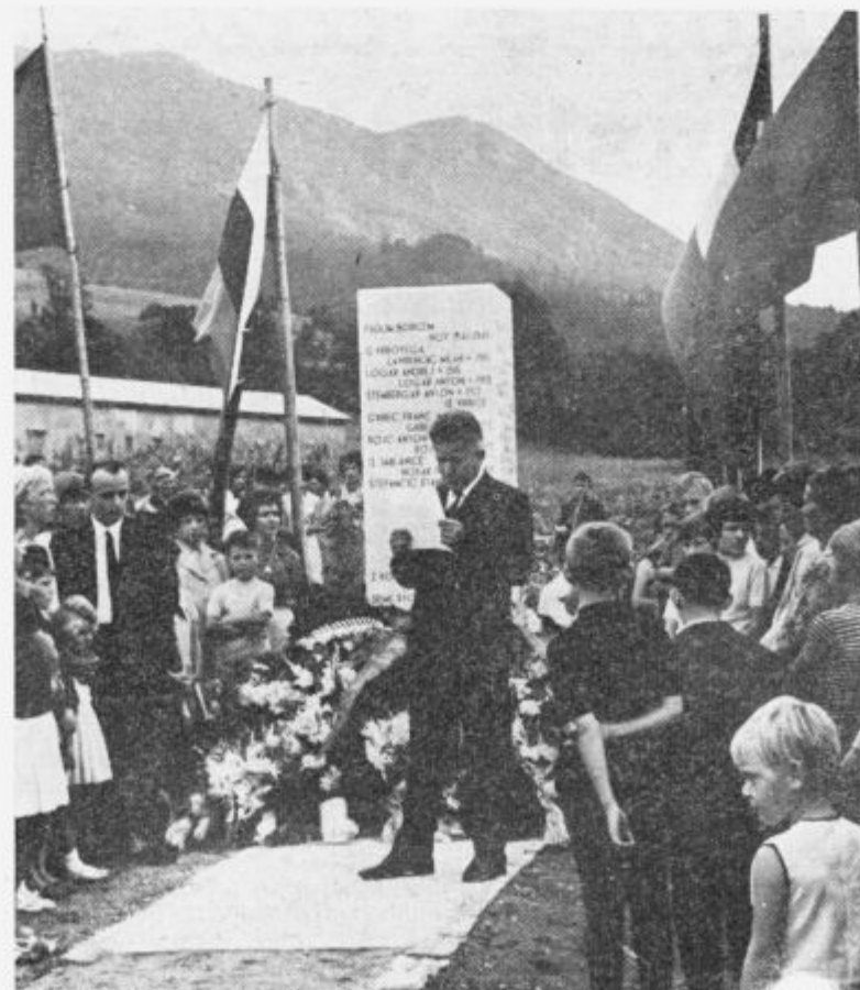
Dne 6. avgusta letos so odkrili v Vrbičah lep spomenik padlim borcem in žrtvam fašističnega terorja iz te vasi in iz Vrbonega ter Jablanice.

ke marljivih uslužbencev. Videti je, da prebivalci občine Ilirska Bistrica pisma raje berejo, kot pa pišejo.