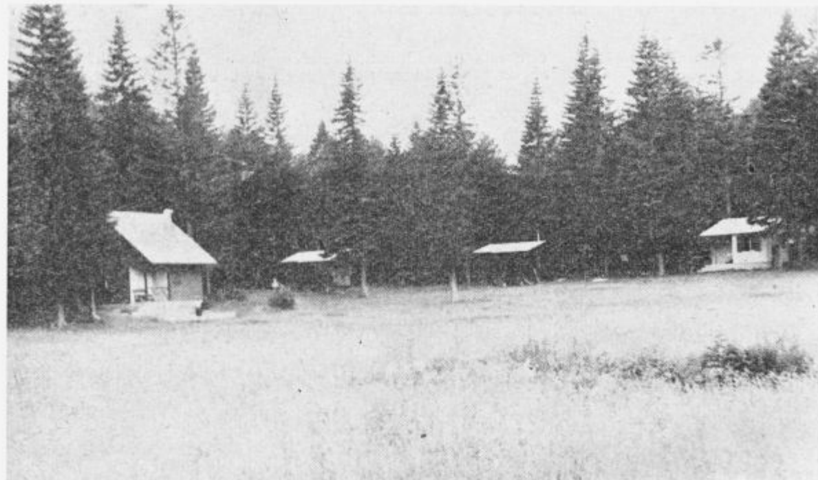
Vikendj na Sviščakih

»Kupili 64 rjuh, več odej, blazine, preproge, uredili pod in napeljali vodovod v kuhinjo...«