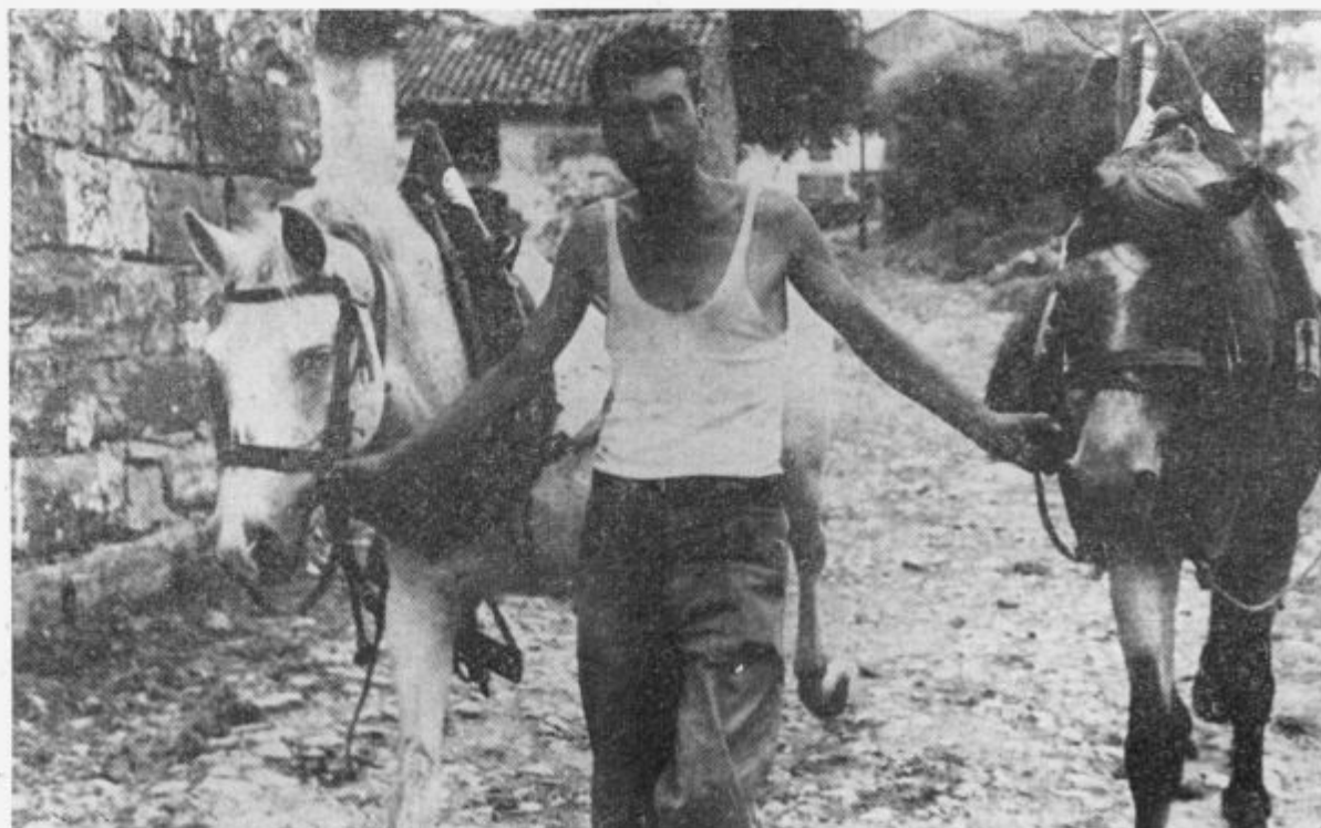
Kmet iz Gornjega Zemona, ki si je poiskal ženo v Dalmaciji

ravlja mrvo, zato sem se moral na hitro roko poslovit.