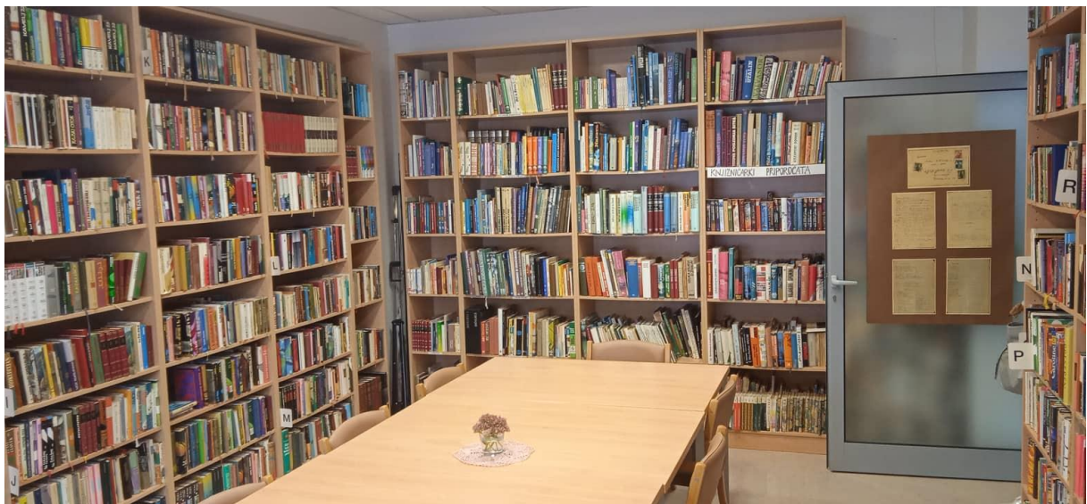
Slika 2: Zbirka v Koroškem domu starostnikov Slovenj Gradec

Na primeru Koroške v domovih za ostarele knjižnica nima premičnih zbirk v pravem pomenu besede, torej knjige niso evidentirane in niso urejene po UDK sistemu. Namesto tega pa obstajajo dokaj obsežne lastne zbirke knjig, ki se v glavnem dopolnjujejo iz podarjenih zbirk varovancev in darov knjižnice (Slika 2). Zbirko urejata knjižničarki, ki redno zahajata v dom, knjige so razvrščene glede na žanr in ne po abecednem redu, kar je za uporabnike mnogo bolj prijazno, saj starejši uporabniki praviloma ne razumejo UDK sistema (Rožanec, 2016, str. 73). Posebej je izpostavljena polica 'knjižničarki priporočata', kjer so postavljene praviloma novejšje knjige s tematiko oziroma žanri, ki so med varovanci najbolj priljubljeni.