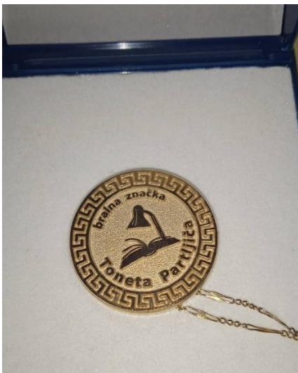
Slika 3: Bralna značka Toneta Partljiča

Povedala je še, da je tudi sicer aktivna v raznih društvih in posebej izpostavila Bralno značko Toneta Partljiča. Slednji je namreč večkrat na obisku in med oskrbovanci posebej priljubljen. Tone Partljič je na lastno pobudo organiziral bralno značko, ki jo je sogovornica tudi prejela in jo hrani v škatli z ostalo zlatnino (Slika 3). Pri tej bralni znački se pretežno berejo Partljičeve knjige, pa tudi druge, glavni namen pa je druženje in vzpodbujane bralne kulture.