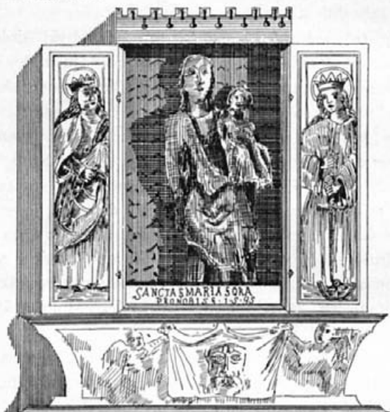
Altarna vratica v podružnici sv. Petra na Vrhu.

božje z detetom Jezusom v naročju. Pred seboj imamo pravcati gotski altar na vratica (Flügelaltar), prej ko ne edini te vrste na Kranjskem.