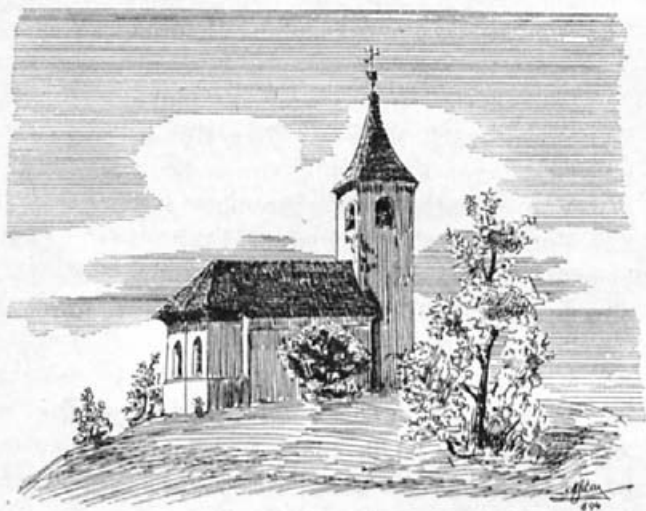
Podružnica sv. Petra na Vrhu.

Na pogorju med želimeljsko in šentjurijsko dolino se vzdiguje precej visok stožčast hrib, kateri je na vshodu obrasten z bukovim drevjem, proti vrhu pa gol. Na vrhu hriba