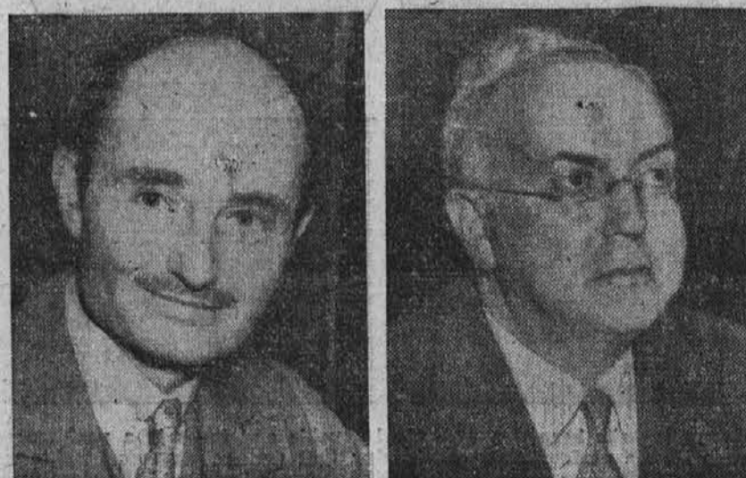
Left shows Francis Biddle, former U. S. attorney general, who has been named the American member of the four power military tribunal that will try the major Axis war criminals. Judge John J. Parker, of Charlotte, N. C., has been named as Biddle's alternate. Parker was nominated by President Hoover to the Supreme court but rejected by the senate.