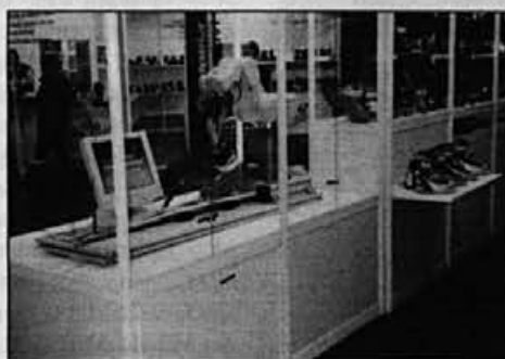
Obiskovalci so si lahko ogledali delovanje novega modela tekaškega čevlja SK 2002