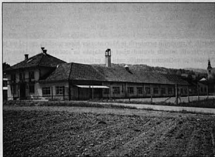
Obrat v Gorenji vasi.

Druga pomembna zadeva pa je tudi kakovost. Kako je z njo zadovoljna Jelka Mur? »Nikoli ni tako dobro, da se ne bi dalo kaj izboljšati,« je menila. »Zadnjič smo imeli vodje oddelkov in nekateri stro-