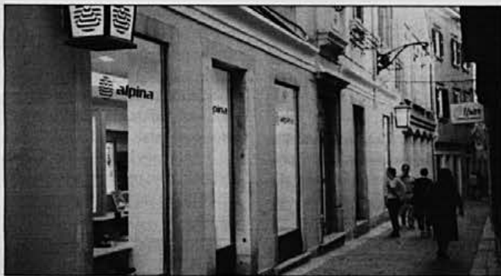
Prodajalna v Kopru je v starem mestnem jedru. Zanimivo – imenuje se Čevljarska ulica.

Ko sem jo vprašala, kako sama ocenjuje letošnje jesensko zimsko modele, je pohvalila: »Nekateri modeli so zelo trendovski. Oblikovalci niso pozabili na klasiko, ki jo še vedno prodamo največ. Tudi športna obutev je lepa.« Povedala je še, da kupci, zaradi bližine meje, večkrat sprašujejo po podobnih modelih kot so jih videli v Italiji. »Meja ima po mojem mnenju dobre in slabe strani. S tem živimo in s tem se moramo