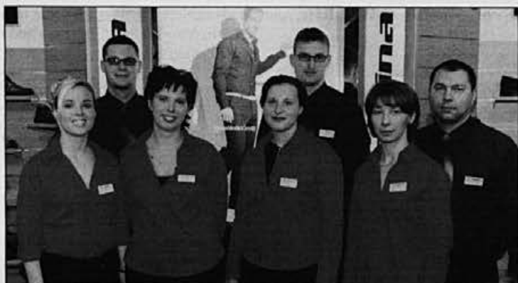
Za dobro prodajo bodo skrbeli prodajalci.

Alpina ima v teh prostorih dve prodajalni. V prvi etaži je običajna prodajalna, kjer prodajamo modno in športno obutev, v kleti pa je še industrijska prodajalna. Tako lahko kupci izbirajo med novjšimi in kakovostnejšimi modeli, lahko pa se odločijo tudi za starejše, desortirane, po kakovosti pa mogoče nič slabše