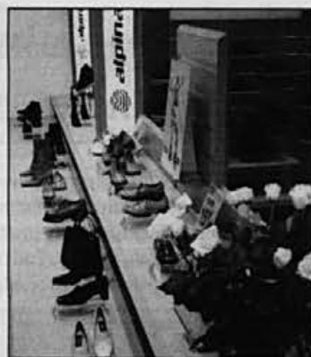
Kupce privabi tudi lepo urejena izložba.

Povedala je tudi, da je zaradi bližine Italije tu večje povpraševanje po bolj modni obutvi. Obmorska kli-