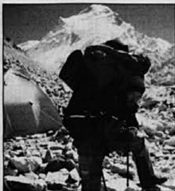
Aleš Miklavčič – vrnitev z zadnje- ga poskusa vzpona na Čo Oju