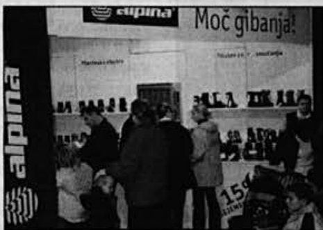
Proti večeru se je prodajni prostor Alpine napolnil.