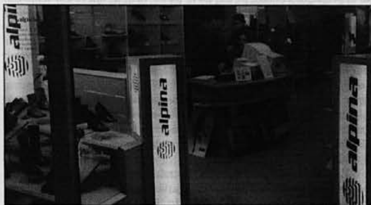
Alpina, Alpina, Alpina ... da kupci vedo, da stopajo v našo prodajalno.

potarnala: »Toliko je novih stvari. Ker nimamo izkušenj, niti ne vemo, kaj naj vprašamo. Smo pa veseli, ker nam nadrejeni in kolegi vse zelo lepo in potrpežljivo razložijo.«