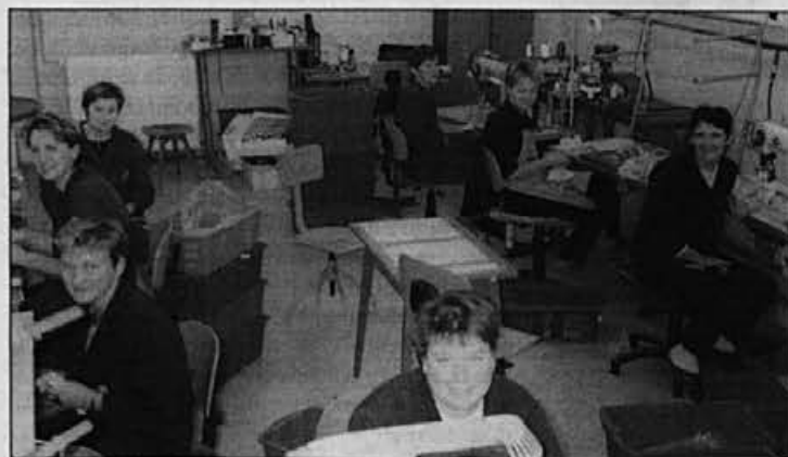
Drugi rink – Ordesa