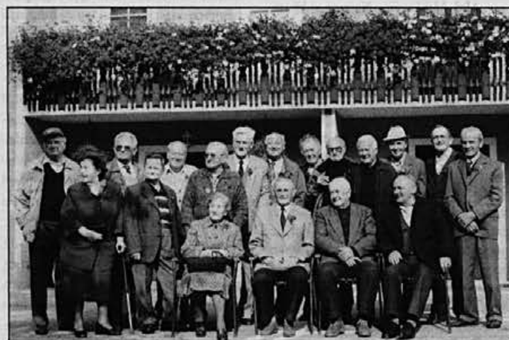
Borci Jurišnega bataljona se vsako leto zberejo pri Županu na Dobračevi.