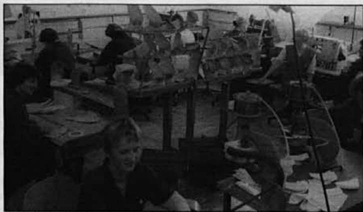
Prvi rink – Elita