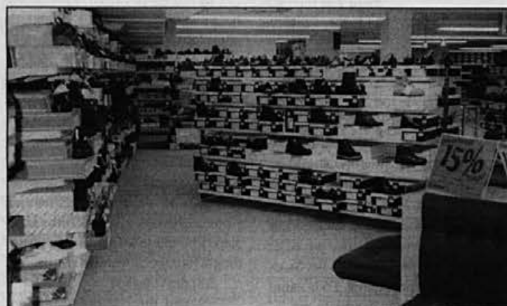
V kletnih prostorih imamo tudi industrijsko prodajalno.

starostne razlike, zato mislim, da bo šlo,« je dejala. Povedala je tudi, da je Alpino poznala že prej. Sestra je večkrat kaj kupila v Alpini. »Danes pa sem si tudi sama kupila Alpinine čevlje. Tele živo rdeče, z visoko peto,« je pokazala in dodala: »Lepi so.«