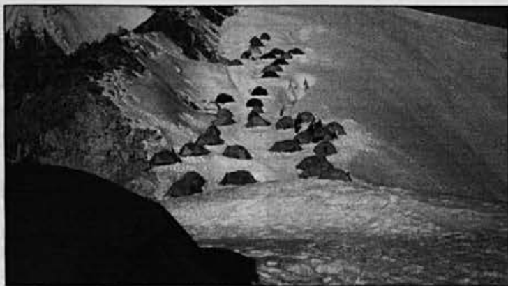
Prvi višinski tabor izpred šotora naše odprave

Do te višine ni bilo snega in do tu sem bil obut v Alpinine čevlje.