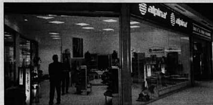
Imamo lepo urejeno in veliko prodajalno.