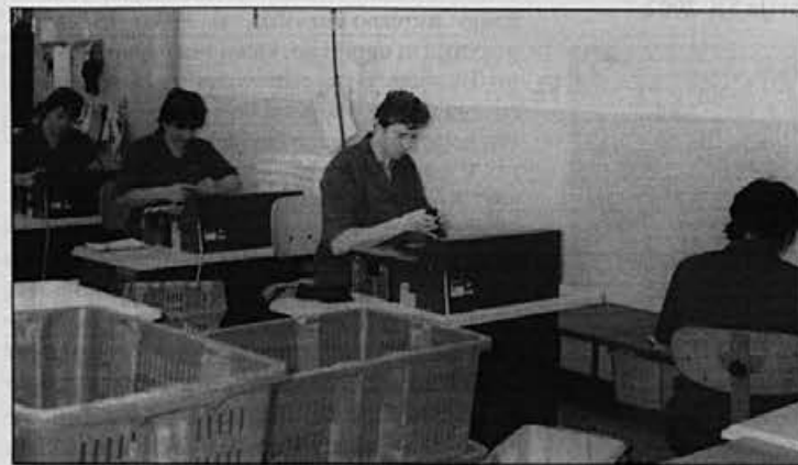
Prikrojevalnica – tanjšanje jedra