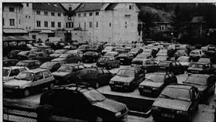
Upamo, da bomo odslej tudi tisti, ki pridemo kasneje, našli prostor za svojega jeklenega konjička.

Že dalj časa smo v Alpini ugotavljali, da nam primanjkuje parkirnišča za naše jeklene konjičke. Konec junija smo, tudi s ciljem, da bomo povečali število parkirnih mest, začeli urejati obrežje potoka Jezernica ob parkirišču. Novembra smo uspeli parkirišče urediti do te mere, da je možno parkiranje. Tako smo pridobili približno štirideset parkirnih mest, kar naj bi zaenkrat zadostovalo za naše potrebe. Do dokončne ureditve manjka še postavitev ograj, asfaltacija, označitev parkirnih mest, ureditev osvetlitve v kolesarnici.