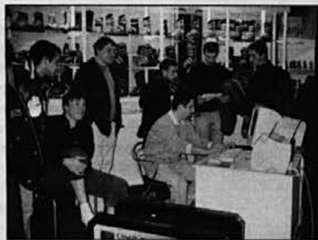
Prišlo je tudi mnogo Žirovcov. In zakaj ne bi izkoristili priložnosti in si izmerili nog.