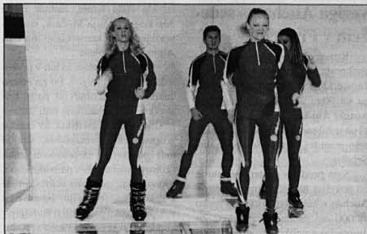
Alpina je eden izmed vodilnih svetovnih proizvajalcev tekaške obutve, zato je prav, da se na modni reviji prikaže tudi v tej podobi.