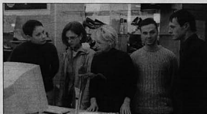
Pred odprtjem je treba urediti in si zapomniti še toliko stvari.