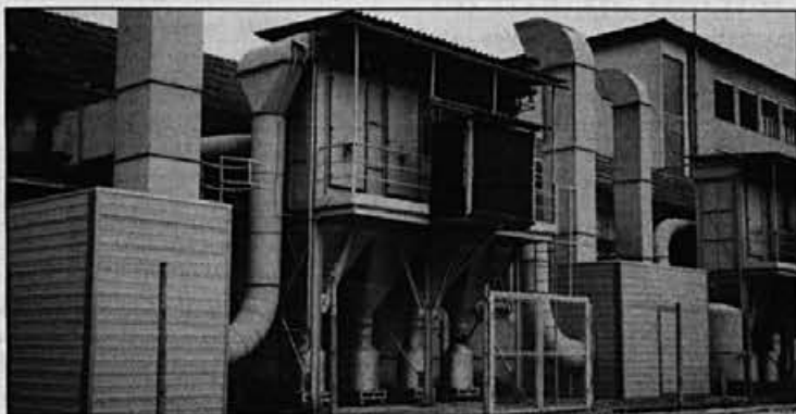
Alpina skrbi tudi za okolje – nova protihrupna zaščita.

Letošnje leto je bilo z meritvami hrupa v bivalnem okolju ugotovljeno, da prekoračujemo mejno dovoljeno vrednost. Da bi zadovoljili zakonskim predpisom in zmanjšali moteč vpliv hrupa, smo okrog ventilatorjev, ki so glavni povzročitelj hrupa, postavili protihrupne kabine. Te so iz istega materiala kot protihrupne ograje postavljene ob avtocestah. Pri ponovnih meritvah je bilo ugotovljeno, da je emisija hrupa s to sanacijo, v mejah dovoljenega.