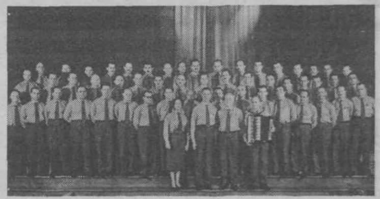
Eden prvih nastopov partizanskega pevskega zbora v Ljubljani