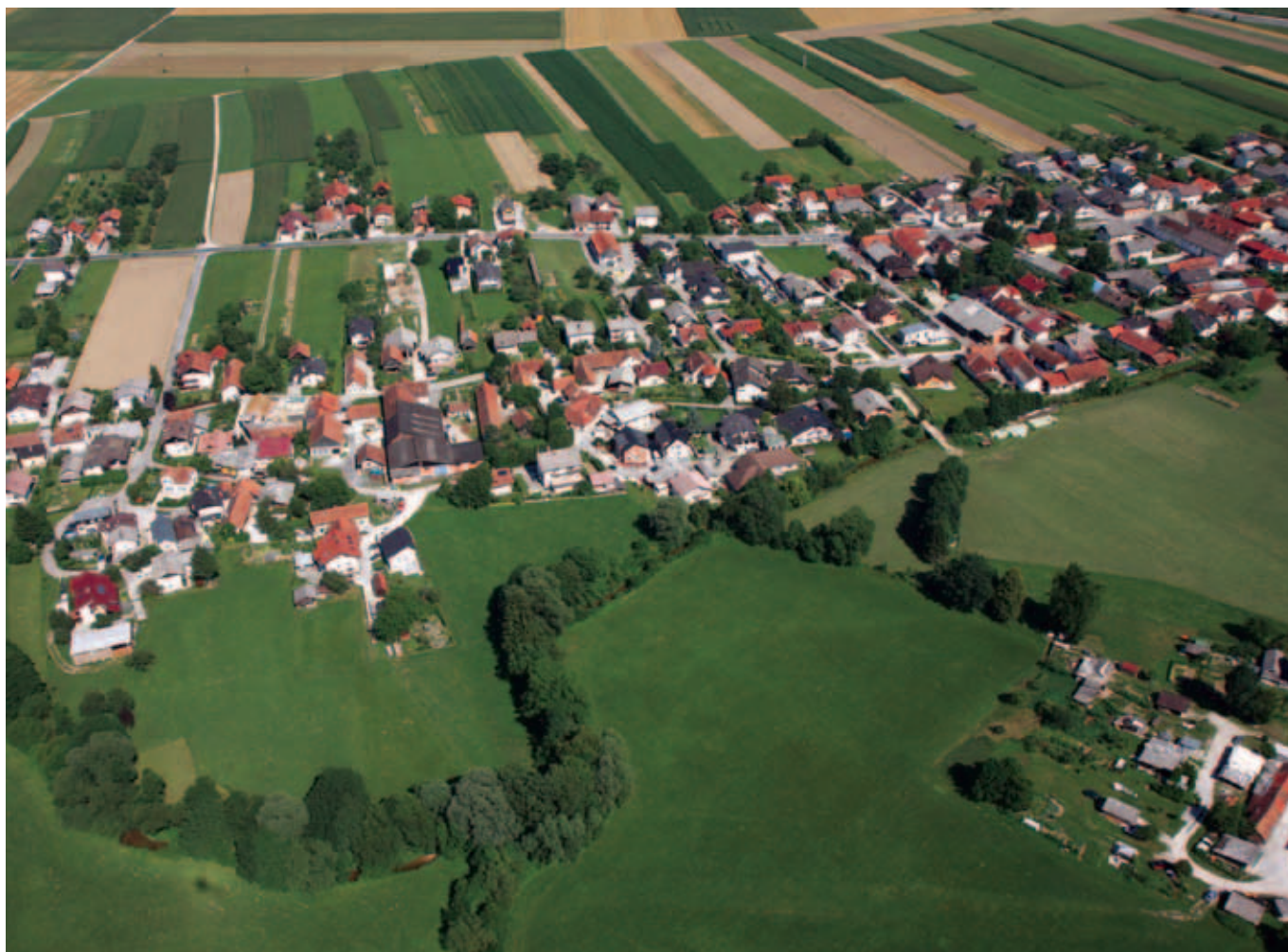
Posnetki Trzina iz zraka