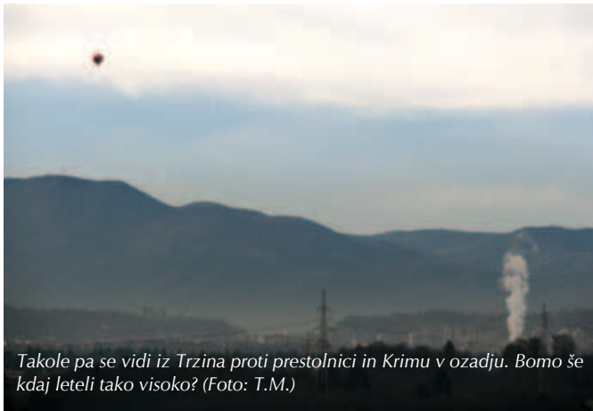
Takole pa se vidi iz Trzina proti prestolnici in Krimu v ozadju. Bomo še kdaj leteli tako visoko?

Takole, drage in dragi moji, poletja je konec in pika, na zahodu pa spet nič novega. No, nekaj boljše je pod Ongrom in okrog njega, pa vendarle se dogaja precej manj kot pretekla leta. Tudi glasilo, ki je pred vami, je spet pri starem tiskarju z novimi cenami in krajšim obsegom. Končno smo spoznali, da ima tudi rast omejitve, najbolj pa so se užteli tisti, ki so delali načrte (berite: jemali kredite) na temelju prejšnjih trendov in sedaj nimajo kje jemati. Nekaj pa je še vedno takih, ki lahko vedno kje vzamejo, če ne drugače, pa na račun drugih. Vremenska rubrika seveda ni namenjena analizi domačih likvidnostnih težav, vendar se včasih zdi, kot da se nam še vreme posmehuje in v letošnjem poletju se tega občutka kar nekako ne moremo znebiti. Vročina in za večino žal tudi dopust sta za nami, učenci in dijaki so v (vse bolj oguljenih) šolskih klopeh, vreme spet na teh straneh in – v glavnem – vsi zaenkrat še na vajetih. Nekaj časa smo vas pustili z vremenom pri miru na račun poletnega mrtvila, sicer pa – razen pasje vročine – v letošnjem poletju nismo imeli kaj vremensko posebnega, vsaj tak je splošen vtis.