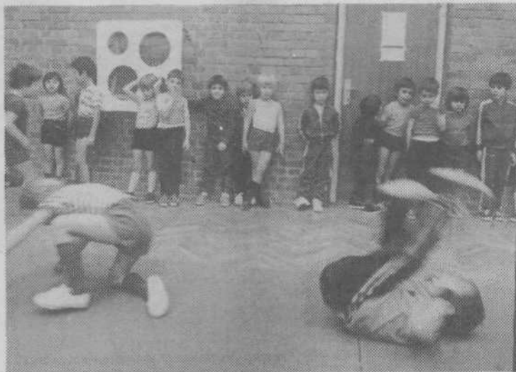
Zmlada je treba začeti