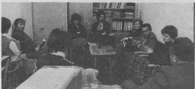
Osnovna šola Prule: večno reformiranje šolstva – kdaj in kako s celodnevno šolo, strokovna problematika

DELO OBČINSKE KONFERENCE ZK V TEM MESECU