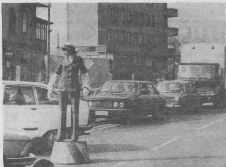
Zlasti sedaj, ko v Ljubljani prenavljamo ceste, trpijo vsi udeleženci v prometu. To je sicer cena, ki jo plačujemo, da se bomo vozili jutri po veliko boljših in varnejših cestah, a so za prenekatero zmedo krivi prav vozniki sami. Prav neverjetno je, kako malo poznajo znake miličnika, ki jih daje bodisi s piščalko ali z rokami. Če bi jih, bi bila marsikatera zmeda manjša.