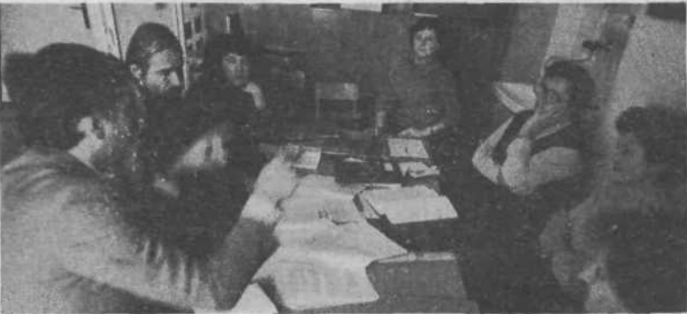
VVZ France Prešeren: Vsebinska uveljavitev načel svobodne menjave dela, neposredni kontakti s KS in OZD