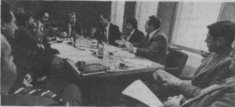
Iskra SOZD: v sestavljenih organizacijah združenega dela je vprašanje medsebojnih dohodkovnih odnosov v prvem planu