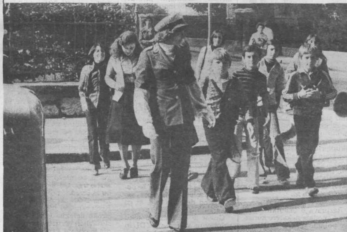
Kadar gre za varnost otrok, ni nikakršen trud odvečen, nobena naloga ni in ne sme biti težka. Otroci in starejši občani ali bolni ljudje so v prometu najbolj ogroženi. V prvih devetih mesecih letos, je bilo v Centru 23 nesreč, v katerih so bili udeleženi otroci. Med njimi je bilo 6 hudo in 20 lažje ranjenih. Devetkrat so nesrečo povzročili otroci, 14 krat pa drugi. Poglejte, v spremstvu staršev so doživeli otroci 6 nesreč.

Zato tudi od načrtovanega pogovora o prometni problematiki ni bilo nič, vsaj tako ne kot smo si ga mi predstavljali, a nam ni žal. Imamo zato fotografije, ki jih je Valči komentirala, saj sama pravi, da je treba probleme odpravljati tam, kjer nastajajo.