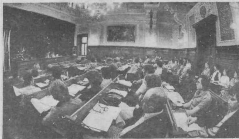
SEJA PREDSEDSTEV SO in OK SZDL

Verjetno je eden od razlogov za živahno razpravo o os-