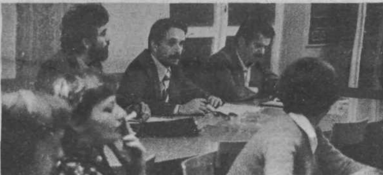
Chemo: trgovina in proizvodnja – z roko v roki v skupen dohodkovni odnos