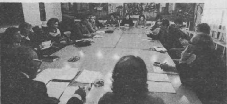
GP Tehnika: Fluktuacija, na pol panožno povezovanje na tapeti