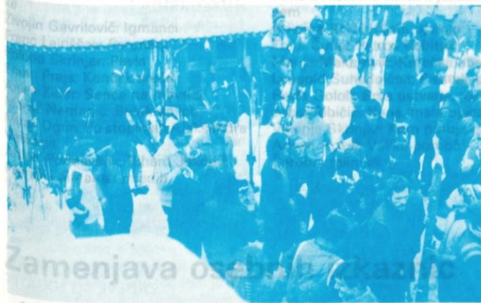
Zamenjava osebne kartice Tekmovalo je več kot 180 smučarjev iz vseh okoliških krajev - tudi iz Žirov in Šentjošta.