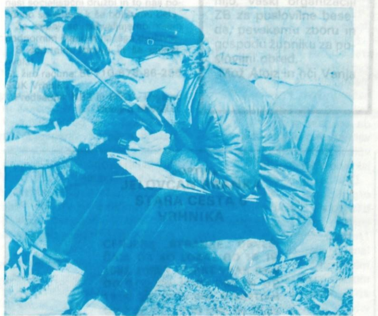
ZAHVALA V Rovtah je bilo vreme sončno, počutje pa prijetno, saj je za to skrbel reporter Sinki!

Judita Treven Petkovec 46 61373 Rovte Tekst in foto: KAMELA 2