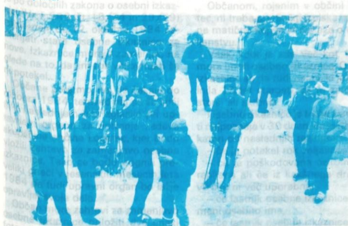
Vzdušje je bilo ves čas zelo prijetno, izbira smučī pa skoraj večja kot v Slovenijašportu.