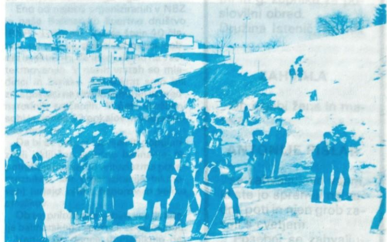
ZAHVALA »Kako se bo peljal naš 'taman'?« »Kako pa naš 'tastar'?« (Tekmovali so cicibani do 6 let, pa veterani, vmes pa še smučarji razvrščeni v sedem kategorij.)