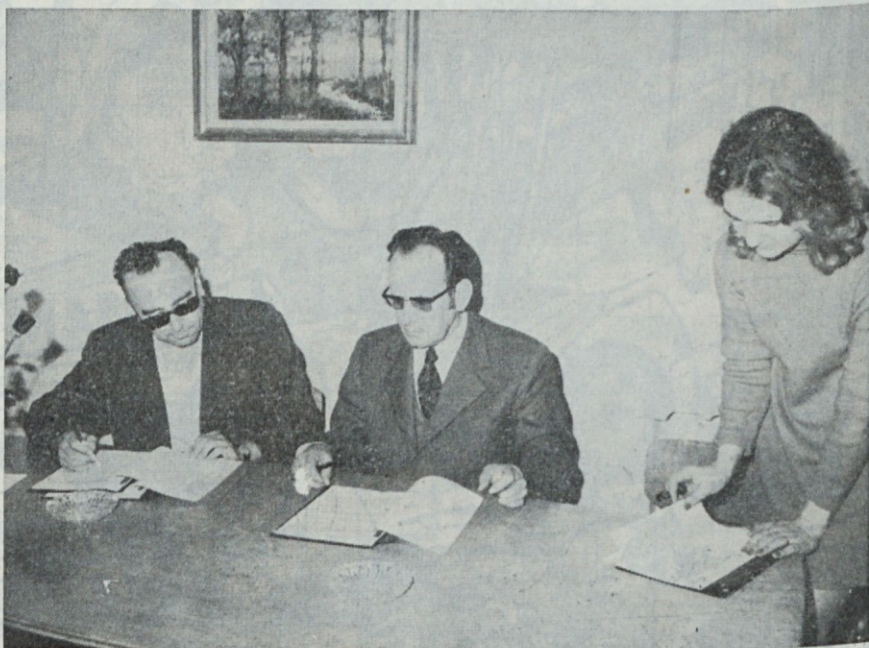
Zadnji pregled in podpis pogodbe

Zaradi vsklajevanja potreb medsebojnega sodelovanja, pogodbenika ustanovita koordinacijski odbor, ki ga sestavljajo s strani Tosame vodja komercialnega sektor-