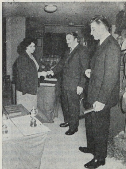
Priznanje in čestitka za tridesetletno delo v podjetju