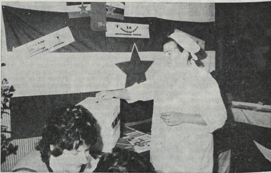
Večina naših volilcev se je odločila za enotno zdravstveno zavarovanje

Volilci smo zaprli ob osemnajstih in pet minut. Prešteli smo glasovalne lističe, jih sortirali: ZA, PROTI in neveljavne. Rezultati gla-