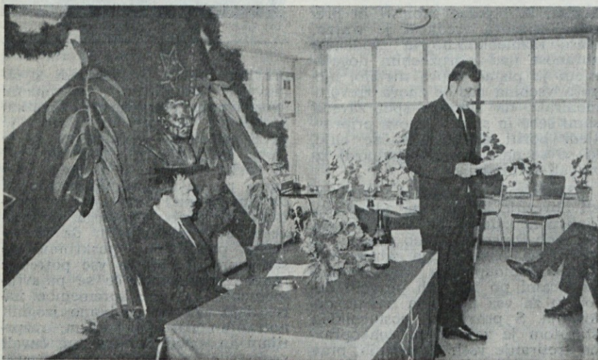
...čim boljši notranji odnosi organiziranost in povezava opravil služb in sektorjev....

Predlogi novih predpisov za reševanje dolgotrajne nestabilnosti našega gospodarstva, ki bodo zaživel z novim letom kažejo, da bo bumerang slabega gospodarjenja na nas. Treba bo gospodariti previdno in pravilno. Ob preveliki ponudbi na domačem trgu, ob skorajšnji dodatni konkurenci nekaterih naših artiklov, ob nenehni možnosti, da se konkurenca še poveča,