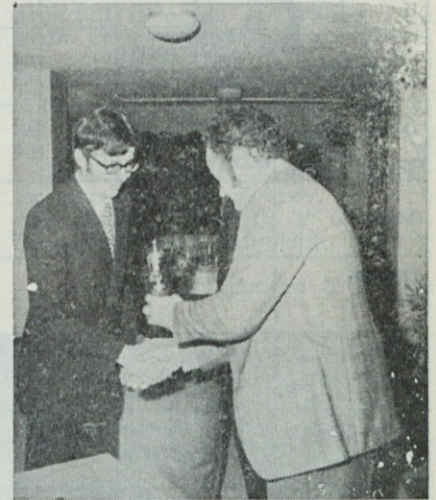
Zmagovalcu v namiznem tenisu pokal in čestitka.

Nagrajenkam čestitamo, vsem reševalcem pa še v naprej želimo dosti uspeha in zadovoljstva pri reševanju naših križank.