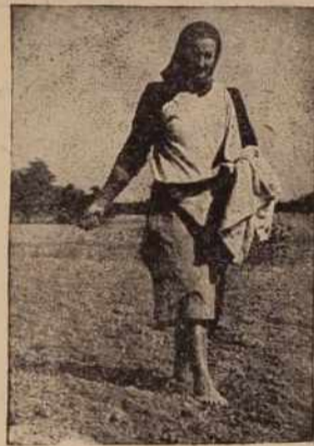
Ročna setev, ki so pa jo že mnogi opustili

V ospredju so pa že ustaljeni načini sklepanja pogodb. Marsikomu se morda zdi, da je plan, ki so ga sestavile zadruge, nekoliko previsok, ker vsi kmetje ne bodo sklenili pogodb, plan pa zajema 57 odstotkov vseh površin, ki so običajno posejane s pšenico. Toda danes so mnogi kmetje že uvideli, da imajo od takega sodelovanja le korist, velika večina starih kooperantov je sklenila pogodbe še za večje površine, izginil je pa tudi strah, da bi kdo izgubil svojo zemljo, če bo sodeloval z zadruzo.