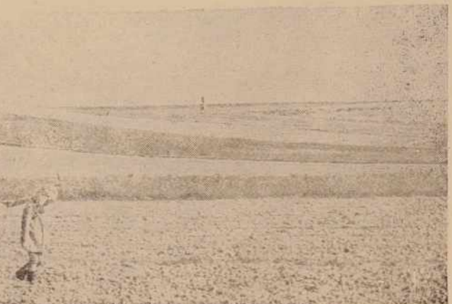
TO JE PA POSNETEK, KI NE VZBUJA ZADOVOLJSTVA. LE DO KOD BOSTA PRISLA IZGARANA KRAVA IN IZMUCENI OTROK?

Iz našega arhiva klišejev smo izbrali nekaj zanimivih posnetkov, ki kažejo prve začetke naprednejšega gospodarjenja v našem kmetijstvu in hkrati tudi nekatere nevesele podobe, ki jih tudi še danes lahko najdemo na poljih. Seveda pa taki prizori počasi ostajajo last preteklosti.