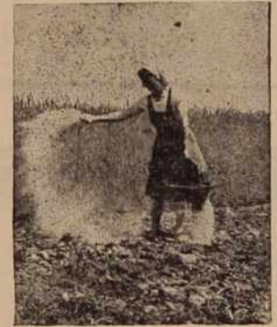
Posnetek iz dni, ko smo tudi pri nas začeli trošiti umetno gnojilo

Ob letošnjem sklepanju pogodb je zaslediti nekaj zanimivih primerov. Mnogi starejši kmetje, ki so za delo že nespособni in jim tud nihče ne more obdelovati zemlje, jo ponujajo v najem. Ob takih primerih zadruge zemljo sprejmejo v najem, lastniki si pa ohranijo ohlajnico. Najemna pogodba mora veljati najmanj pet let, zemlja pa biti primerna za kmetij-