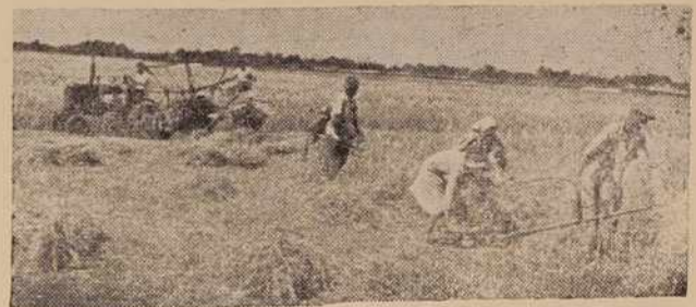
Ob kosih se je pojavil traktor z žetvenico. Vzburil začudenje, vendar so pa že čez nekaj let začeli hrumeti prvi kombajni