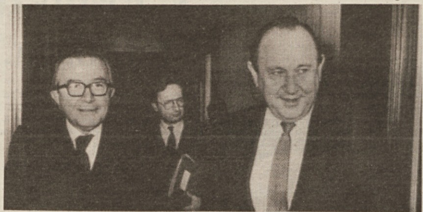
Italijanski zunanji minister Andreotti se je včeraj v Bonnu pogovarjal s šefom zahodnonemške diplomacije Genscherjem. V ospredju problemi EGS ter vprašanje pogajanj med Vzhodom in Zahodom po sporazumu med Gromikom in Shultzom