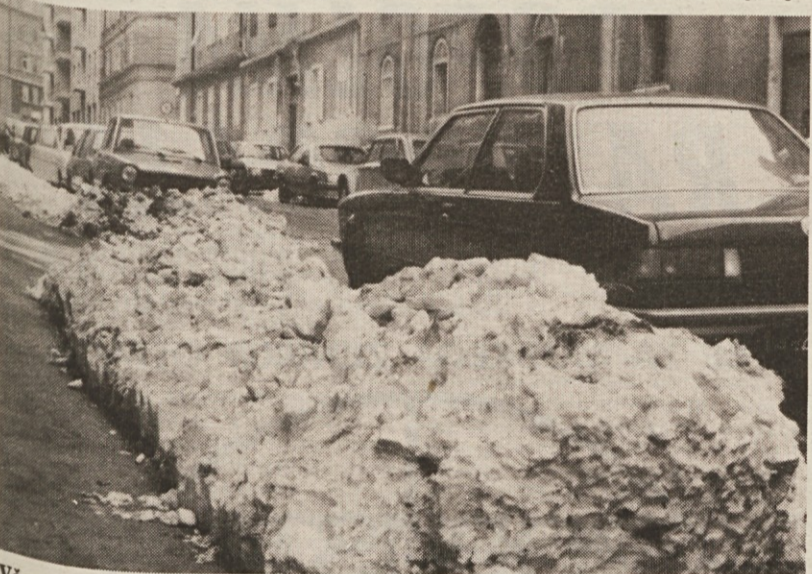
Včeraj so bile vse mestne ulice že bolj ali manj čiste, le ob pločnikih ostajajo visoki kupi snega, ki predstavljajo resno oviro pri parkiranju avtomobilov

Kljub hitremu posegu gasilcev znaša škoda preko 100 milijonov.