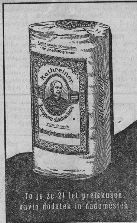
To je že 21 let preizkušen kavin dodatek in nadomestek