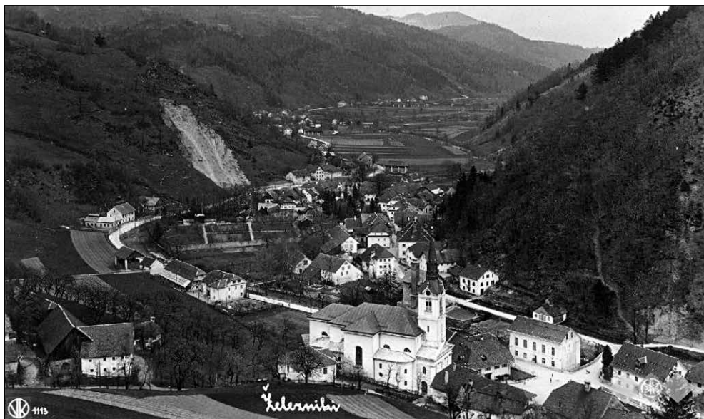
V ospredju Spodnji Železniki (Racovnik in Trnje) z župnijsko cerkvijo sv. Antona na sredini in Škovinami na levi strani. V ozadju ločeni s polji vas Češnjica ter vas Studeno okoli leta 1936 16 .