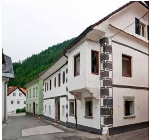
Warlova hiša, 2012.

Čeprav so bili v tistih časih zaradi ognju nevarne gradnje požari dokaj pogosti, pa v primerjavi z ostalimi požari požar na četrtek, 23. maja 1822, izstopa tako po svoji razsežnosti kakor tudi po solidarnostni pomoči s strani dežele ter takratne domovine. Temu velikemu požaru je takoj sledil še manjši požar 31. maja 1822, ki pa je bil omejen na Zgornje Železnike 1,2 . Anton Globočnik v kroniki Železnikov 2 navaja, da se je požar 23. maja začel ob enih popoldne v vigenjcu za Warlovo hišo v Zgornjih Železnikih.