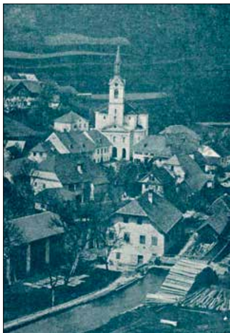
Fotografija, objavljena leta 1892 v reviji Dom in svet, prikazuje Trnje (Spodnji Železniki) 14 . V ospredju je ob kupu hloedov prikazana najstarejša hiša v Železnikih Palmada (dandanašnji imenovana Palnada), v ozadju pa se vidi cerkev sv. Antona.

V nadaljevanju časopisnega prispevka sledi obsežen seznam darovalcev in darov, ki pa ga na tem mestu izpuščamo ter podajamo samo skupno vsoto vseh prispevkov, ki so znašali: 5.045 goldinarjev in 14 \frac{1}{4} krajcarjev v C.M. (Conventmünze) ter 2.276 goldinarjev in 48 krajcarjev v W. W. (Wiener Währung), nadalje 723 \frac{9}{32} mernikov (445 m 3 ) žita ter stročnic in še posamezni darovi v naturalijah.