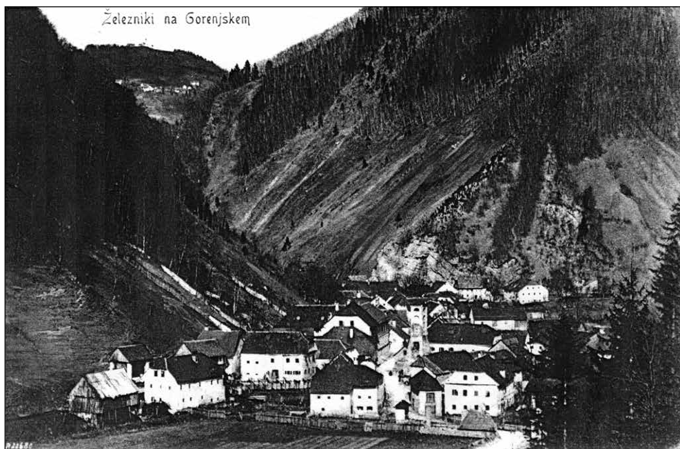
Fotografija Zgornjih Železnikov s plavžem. Ob fotografiji je zapisana letnica 1902. Vir: Jakob Šuštar (Špendalov) 19 .

stori spoznanje, da je po dveh stoletjih takšno ravnanje v Slovencih ostalo. Izkazana solidarnost po poplavih v letu 2007 za zgoraj opisano v ničemer ne zaostaja.