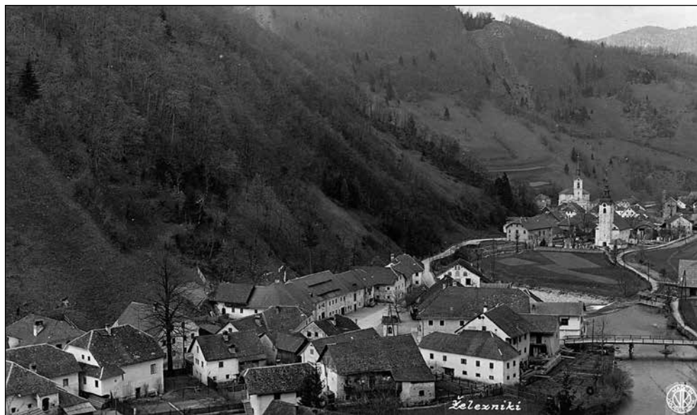
Fotografija z razglednice, poslana 7. 5. 1936, prikazuje trg Na Logu (Zgornji Železniki). 18.

V vsakem primeru lahko sklepamo, da je bila pomoč znatna, saj iz zgornjega časopisnega pri-