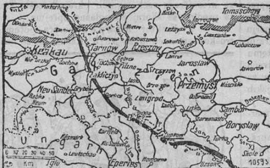
Karte des großen Sieges in den Karpaten.

V zadnji in v današnji številki smo poročali natančno o veliki avstro-ogrsko-nemški zmagi v zapadni Galiciji, ki so jo dosegle združene armade v navzočnosti našega vrhovnega poveljnika nadvojvode Friderika pod vodstvom nemškega generala Macken-sen. Kakor znano, se je v teh bojih do sedaj že čez 100.000 Rusov vjelo in neizmerno bogat vojni plen pridobilo. Prinašamo mali zemljevid onih delov zapadne Galicije, v katerih so se ti odločilni boji vršili.