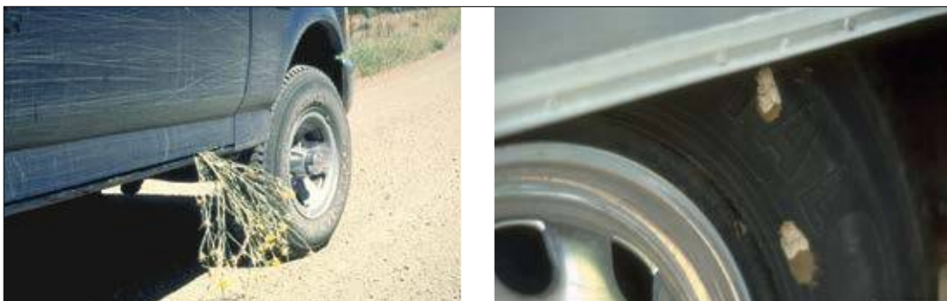
Slika 1: Primer naključnega transporta poletnega glavinca (levo) in navadnega gobarja (desno) s pomočjo vozil

Pri pregledu zakonodaje na področju gozdarstva (Zakon o gozdovih in Pravilnik o varstvu gozdov) smo zasledili nekaj osnovnih ukrepov za preprečitev širjenja in zatiranje rastlinskih bolezni in prenamnoženih populacij žuželk, ki pa ne vključujejo konkretnjših navodil. V 59. členu Uredbe (EU) 2016/2031 o ukrepih varstva pred škodljivimi organizmi rastlin so zapisana splošna določila za