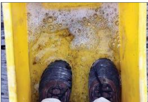
Slika 2: Razkuževanje obutve ob zapuščanju tvegane območja

V akciji Keep it clean so navodila, ukrepe in primere dobrih praks razdelili v tri skupine (Forestry Commission, 2018b): Think kit , Think transport in Think trees . V sklopu Think kit – Pomisli na opremo strokovno javnost pozivajo k odstranjevanju zemlje in organskega materiala ter razkuževanju opreme, ki jo uporabljajo (obutev, oblačila, vrvi in žage) pred vstopom ali izstopom z določenega delovišča (Slika 2). V sklopu Think transport – Pomisli na vozila opozarjajo na odstranitev zemlje in organskega materiala z vozil, kar vključuje pnevmatike, tovorni prostor in vozniške kabine. V zadnjem sklopu priporočenih ukrepov