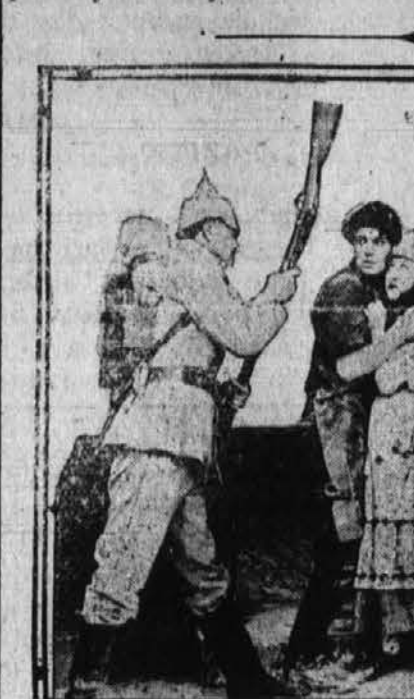
KILL THE BELGIAN SWINE! (SCENE FROM THE NAZGER, THE BEAST OF BERLIN)