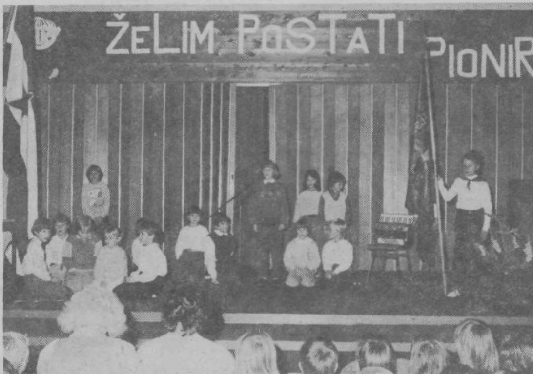
Med slovesnim sprejemom 128 cicibanov v Pionirsko organizacijo so kulturni program pripravili člani dramskega krožka