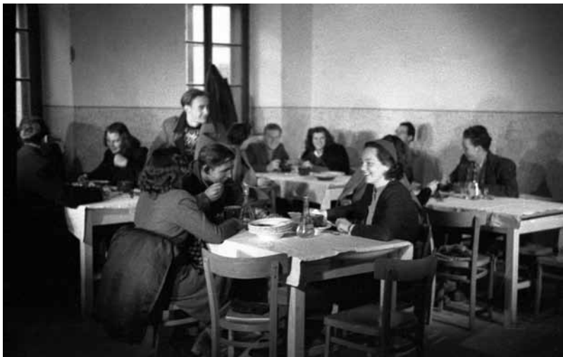
Slika 5: Študenti medicine pri kosilu v prostorih šempetrske vojašnice (Muzej novejšje zgodovine).

verzi nekaj zelo pomembnega in da je tudi najboljša obleka komaj primerna zanj. Naslednji dan je študent prišel oblečen v lepo temno obleko, ki si jo je sposodil od kolega. Dunajska fakulteta, ki je prof. Hribarju in drugim klenim učiteljem MF privzgojila visok odnos do študija, je imela predpis, da študenti pristopajo k izpitom v slavnostni obleki. Tisti, ki je sam ni premogel, si jo je izposodil pri vratarju fakultete. UNRRA je med drugim poslala medicincem zelo velike bele »pajace«, ki so jih pred njimi uporabljali ameriški letalski mehaniki. Bili so iz izredno trdega in debelega blaga. Študentke so te pajace sparale, šivilje pa iz njih s težavo sešile halje za vaje. 18