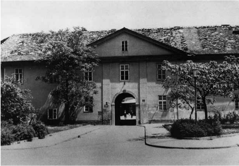
Slika 4: Pročelje šempetrške vojašnice v Ljubljani na Vrazovem trgu 1, ki je nastala leta 1945 kot začasni, a ostala stalni sedež ljubljanske MF.

se je odločila in oddala svojo prijavo. Sprva so se na Univerzi odločili za omejeni vpis ( numerus clausus ), po katerem so nameravali vpisati približno 100 slovenskih študentov in približno 30 študentov iz drugih jugoslovanskih republik. 13 Zaradi številnih protestov so omejitve glede vpisa preklicali in sprejeli vse, ki so izpolnjevali vpisne pogoje. 14 V zimskem semestru 1945/46 je imela MF 27 učiteljev in 508 slušateljev, med njimi 302 novince. 15 Popoln seznam novincev so objavili v Zdravniškem vestniku leta 1995 ob 50-letnici vpisa, 16 prav tako tudi njihove biografije. 17