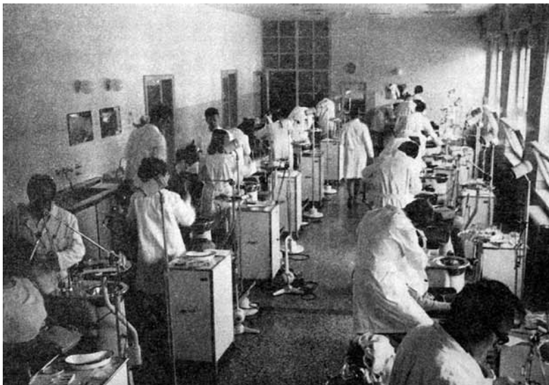
Slika 7: Praktični pouk na stomatološki klinik sredi petdesetih let