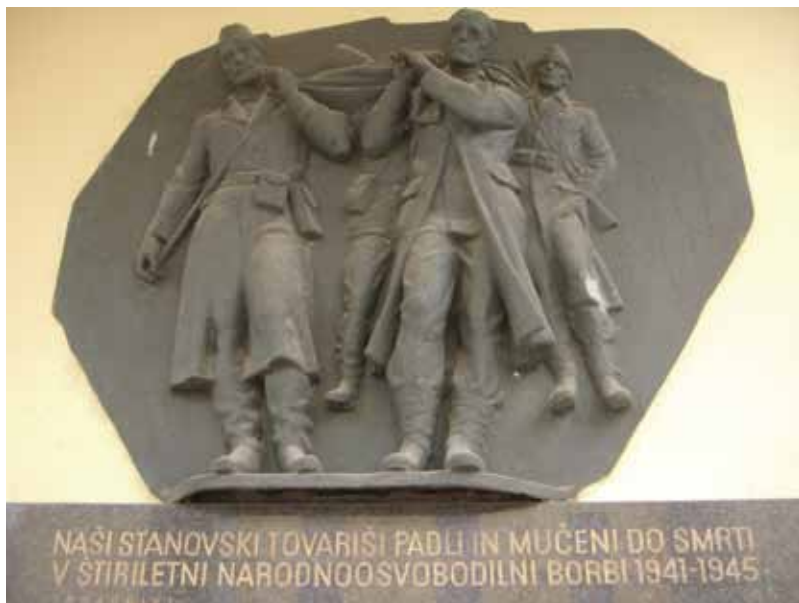
Slika 3: Spominska plošča padlim zdravnikom in medicincem na pročelju nekdanjega Dergančevega sanatorija Emona v Ljubljani na Komenskega ulici 4.