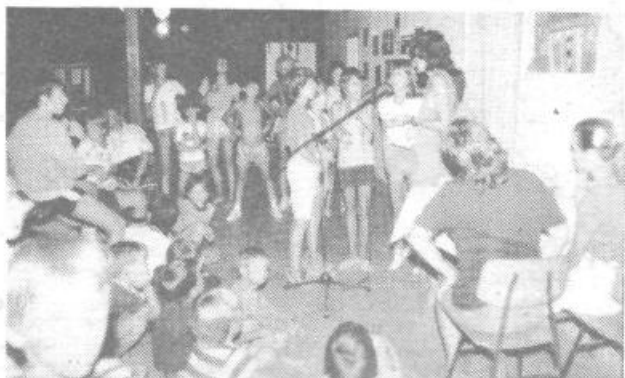
Novo ozvočenje, ki ga je za Pacug kupilo obrtno združenje naše občine, je omogočilo izpeljavo kvizov znanja v jedilnici letovišča in res živahnih plesov v tem prostoru in na plaži