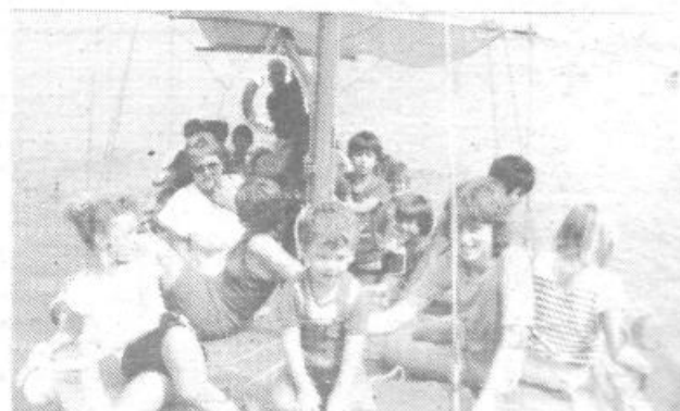
Kot vsako leto je tudi letos Ča te briga popeljal mlade letoviškarje do Pirana in Portoroža

Društvo nekadilcev Ljubljana Siska, ki je pričelo delovati poldrugo leto pred našim, je predlagalo SZDL, naj pripravi, osnutek zakona s katerim bi zaščitili nekadilce, zlasti pa otroke, pred škodljivim vplivom tobačnega dima. To si želimo tudi mi, kljub temu, da nekaj ustreznih zakonov že imamo.