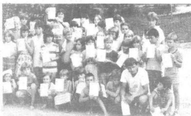
Mnogi otroci iz IV. izmene in fantje in dekleta iz Augsburga so si prislužili bronastega, srebrnega in zlatega delfinčka za dokazane plavalne veščine