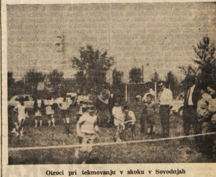
Otroci pri tekovanju v skoku v Sovodnjah