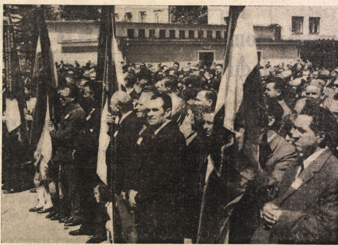
Nedeljskega srečanja bivših tankistov - prekomorcev v Sežani so se udeležili tudi delegacije vseh borbovskih organizacij Primorske, ki so prinesle s seboj tudi svoje prapore. Na sliki nekaj praporov v ospredju.

Po končanem uradnem delu slava se je množica razšla po Sežani med znanice in prijatelje ali pa v dobro pripravljeno gostilno, kjer je do pozno zvečer odmevala partizanska pesem.