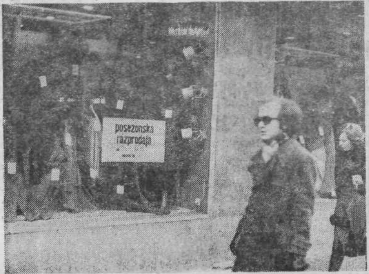
2. POSEZONSKA RAZPRODAJA — V začetku letošnjega leta je bilo nekaj negotovanja, ker so bile številne trgovine zaprte zaradi inventure. Po opravljeni inventuri pa so številna trgovska podjetja pripravila posezonske razprodaje. Vse več ljudi se odloča zanje in svojo garderobo obnavlja po znižanih cenah.