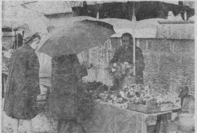
4. POMLADANSKO CVETJE — Ljubitelji cvetja lahko na ljubljanskem trgu že za nekaj dinarjev kupijo pomladansko cvetje. Toplo sonce, ki je v nižjih legah stopilo sneg, je že prebudilo prve znanilce pomladi.