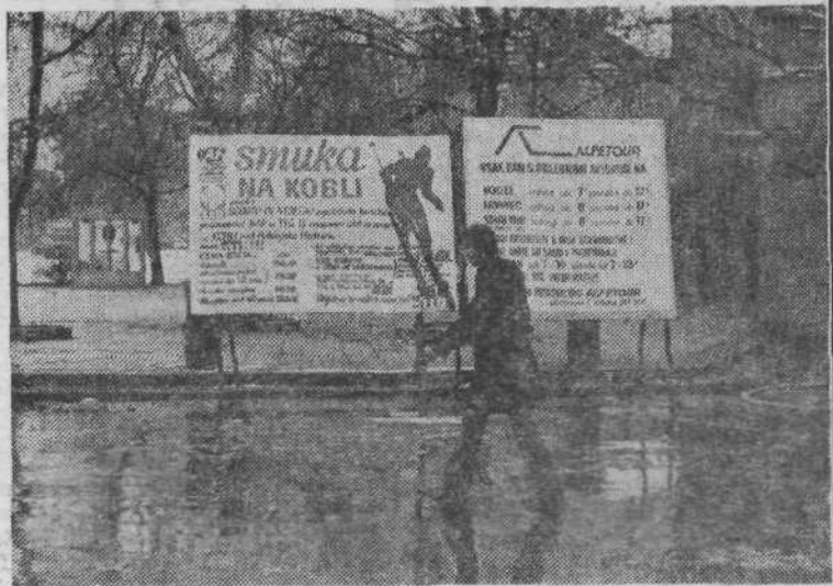
1. ZIMA, ZIMA BELA — Letošnja zima, to moramo vsi prirediti, res ni skopa s snegom. Toplejše vreme je sneg v mestu kmalu pobralo, na vseh smučiščih pa ga je dovolj. Vsa naša turistična podjetja so pripravila številne smučarske izlete in tečaje, tako doma kot tudi v tujini. »Globina žepa« pa odloča o tem, kam bo kdo šel.