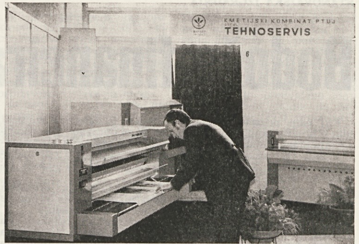
Nov kopirni aparat »Tehnomatic 250«