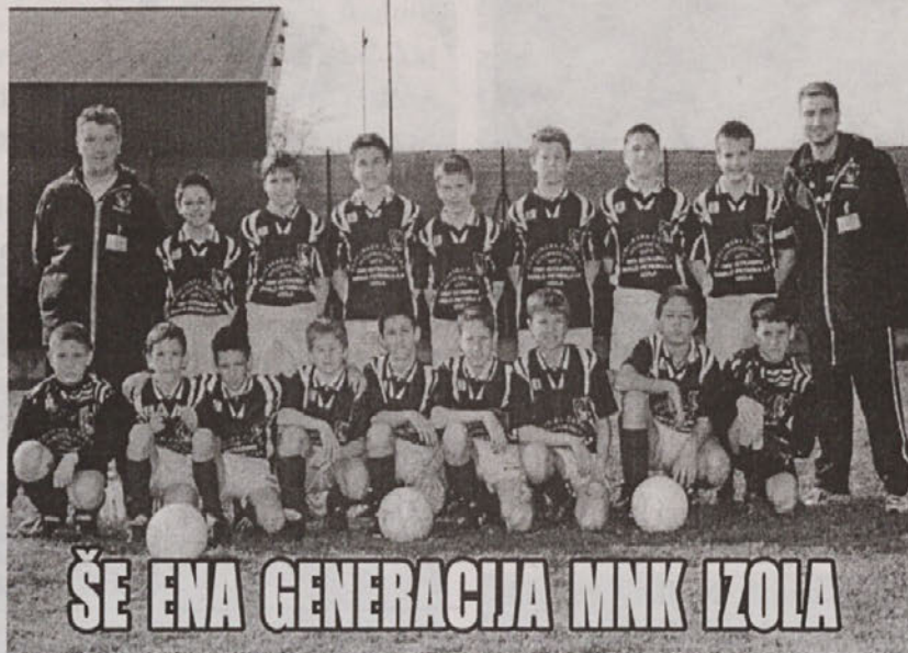
ŠE ENA GENERACIJA MNK IZOLA