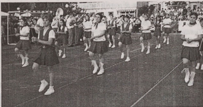
Tradicionalne mažoretke so tokrat prišle iz Povirja.