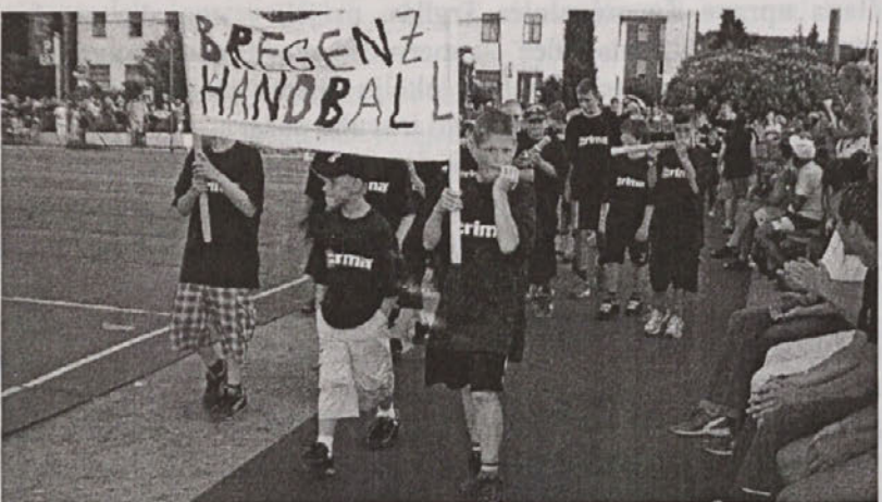
Najbolj glasni so bili mladi igralci iz nemškega Bregenza.