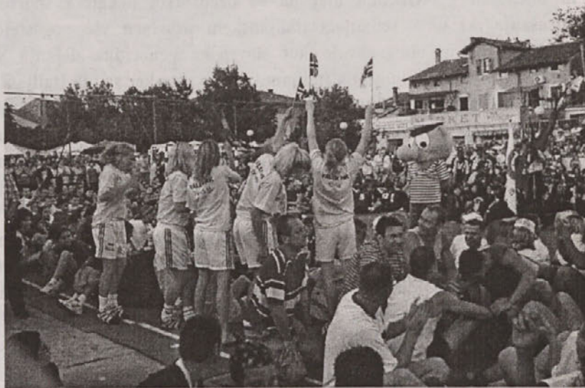
Skandinavci vedo kako je na velikih športnih prireditvah, saj so prav zdaj izolske rokometničice na enem takšnih turnirjev na Švedskem. Tako-le pa so se zabavale Norvežanke.