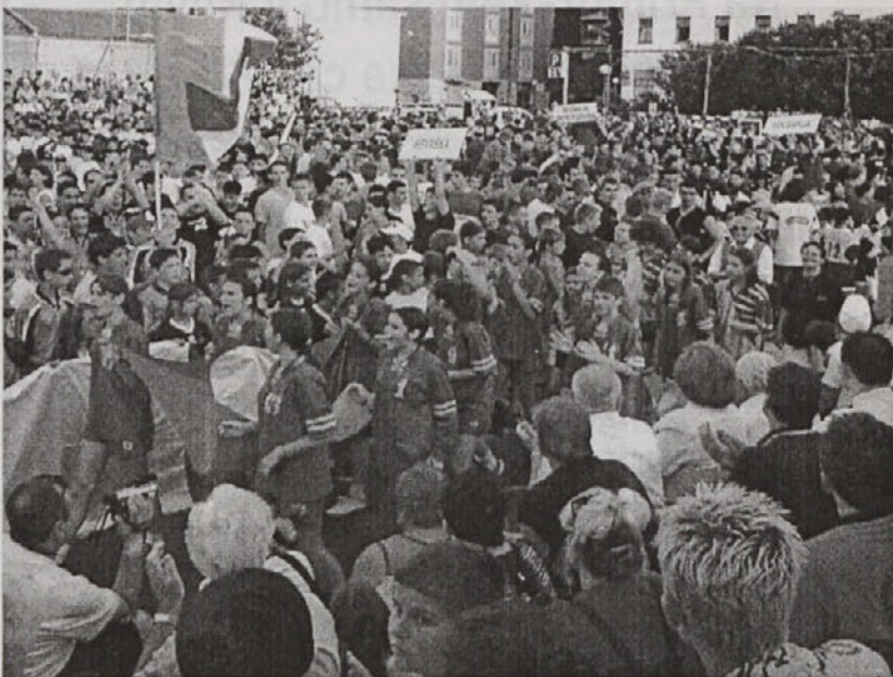
Izola je dovolj velika za ljudi a premajhna za avtomobile. Na Lonko so organizatorji spravili 2000 ljudi parkirnih mest pa je le nekaj več kot 100.