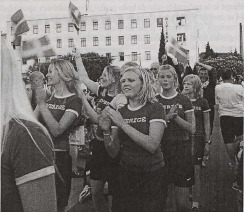
Seveda ni bilo mogoče spregledati lepih švedskih rokometničic.