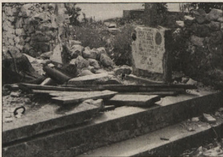
Niti mrtvi ne počivajo v miru. Dračevac je porušen, pokopališče razdejano. Časi, ko sta soseda iz srbske in hrvaške družine sedela pri turški kavi in ob njej kramljala, so za vselej mimo.

Kako globoko prizadeti so prebivalci Bibinja, priča podatek, da tam vsako noč zgori ena izmed hiš srbskih sobeivalcev, ki so uspeli – še pravočasno, v slutnji najhujšega – zbežati.