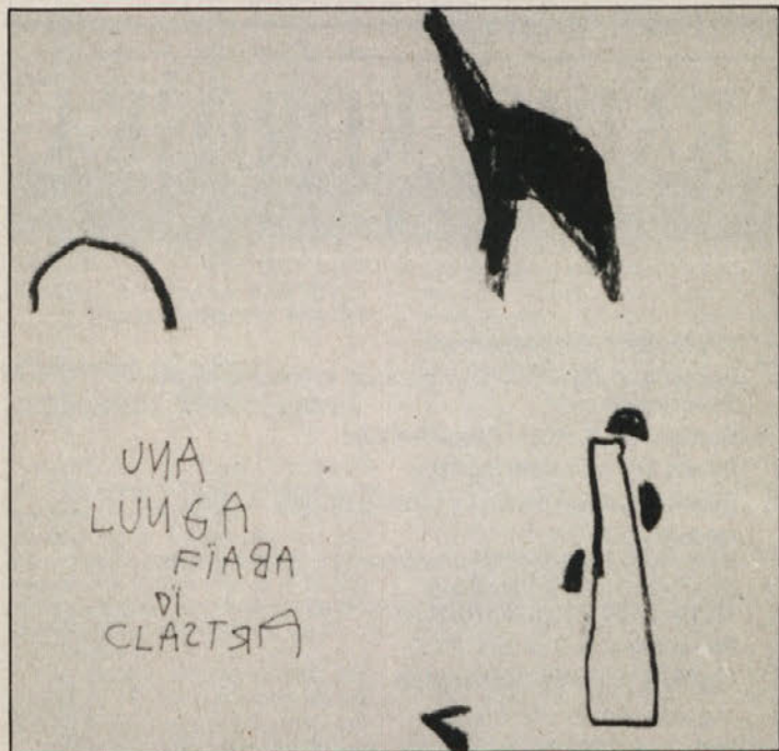
R. Benétik: Skica za Dolgo povest o vasici Clastra

uspelo zbrati še zadnje moči in jih premagati s 7:4.